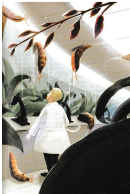
Příloha č. 2: Ilustrace Jakuba Cenkla – zobrazení laboratoře na vesmírné akademii