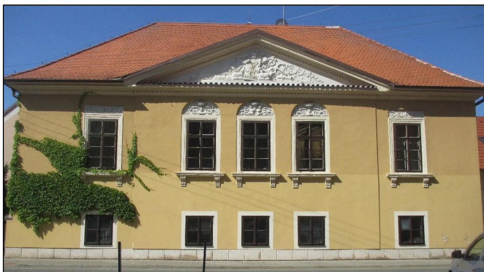
Obrázek č. 14: Empírový dům – Labore et Favore