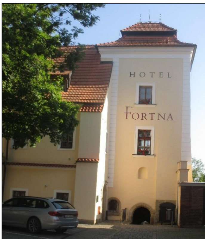
Obrázek č. 11: Ceregettiho dům