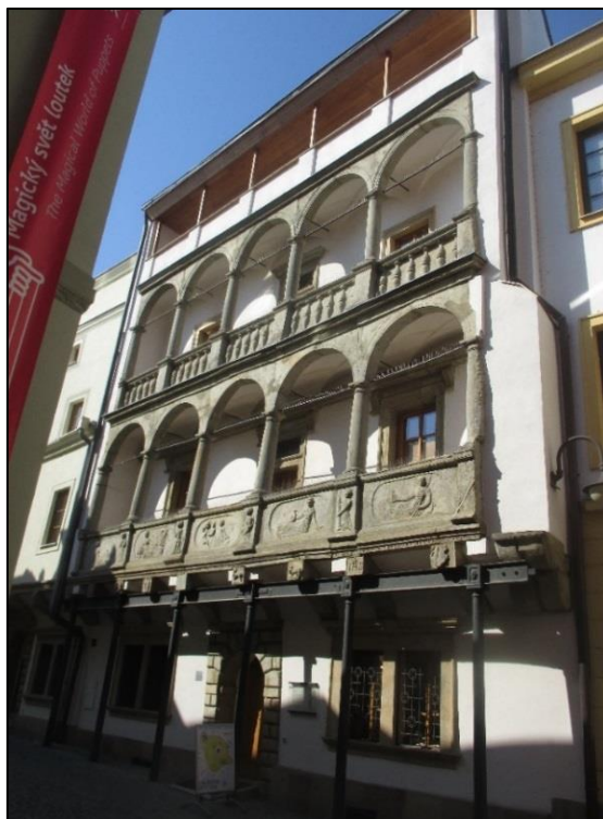
Obrázek č. 17: Mydlářovský dům