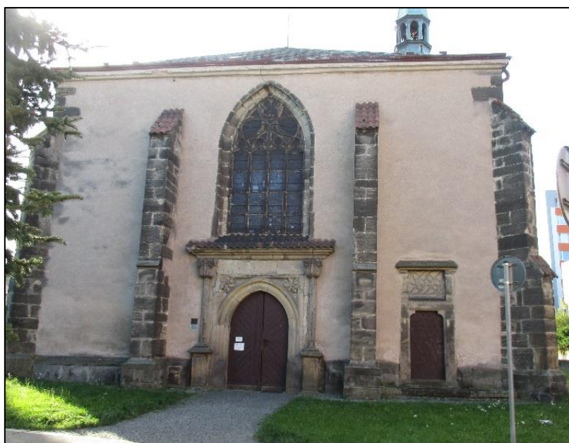
Obrázek č. 6: Kostel sv. Kateřiny (průčelí)