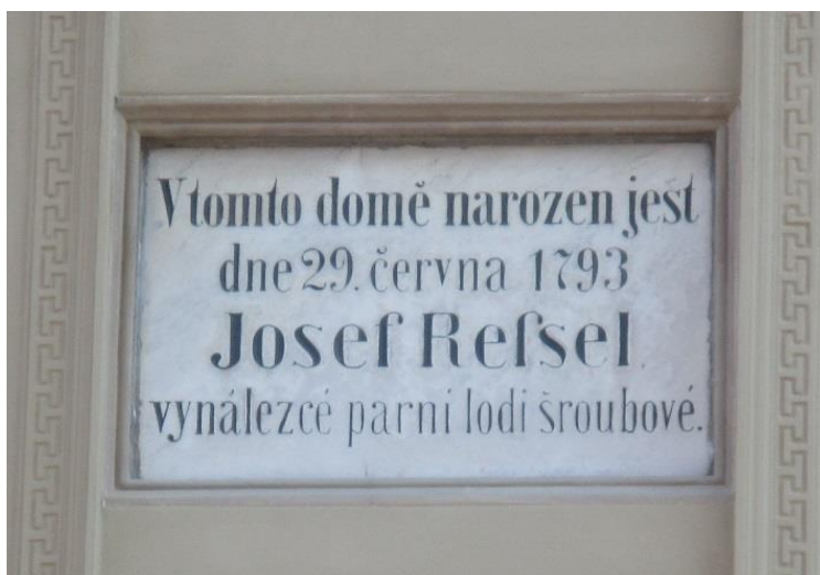
Obrázek č. 21: Rodný dům Josefa Ressela (pamětní deska)