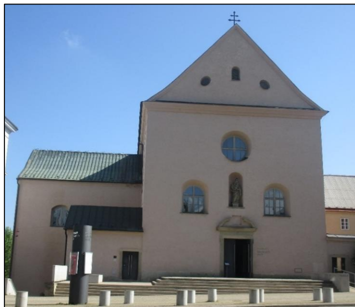
Obrázek č. 2: Kostel sv. Josefa