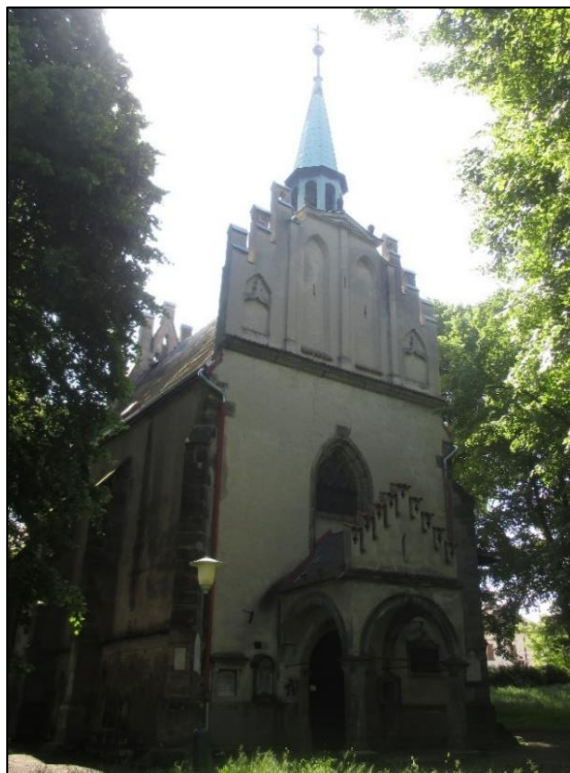
Obrázek č. 3: Kostel sv. Michaela