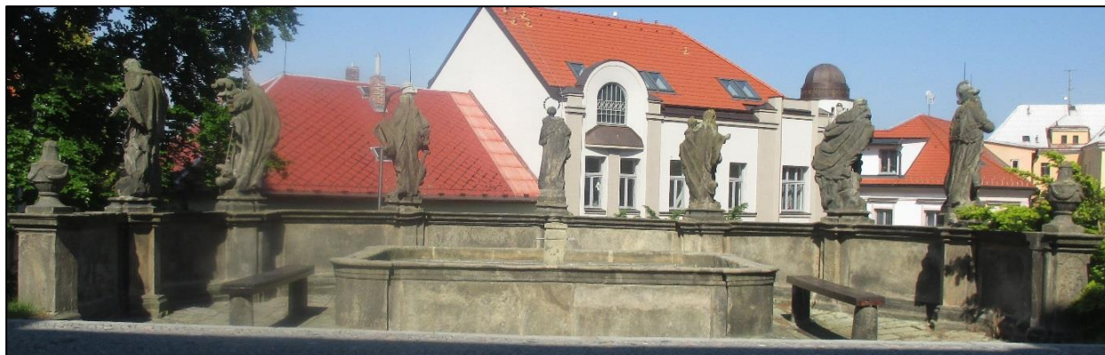
Obrázek č. 27: Novoměstská kašna