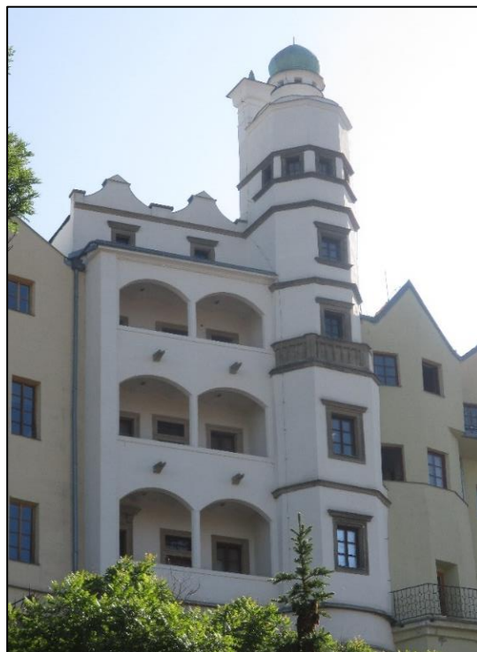
Obrázek č. 18: Mydlářovský dům (zadní strana)