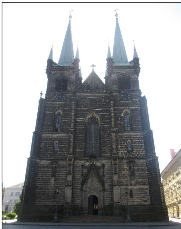
Obrázek č. 1: Kostel Nanebevzetí Panny Marie