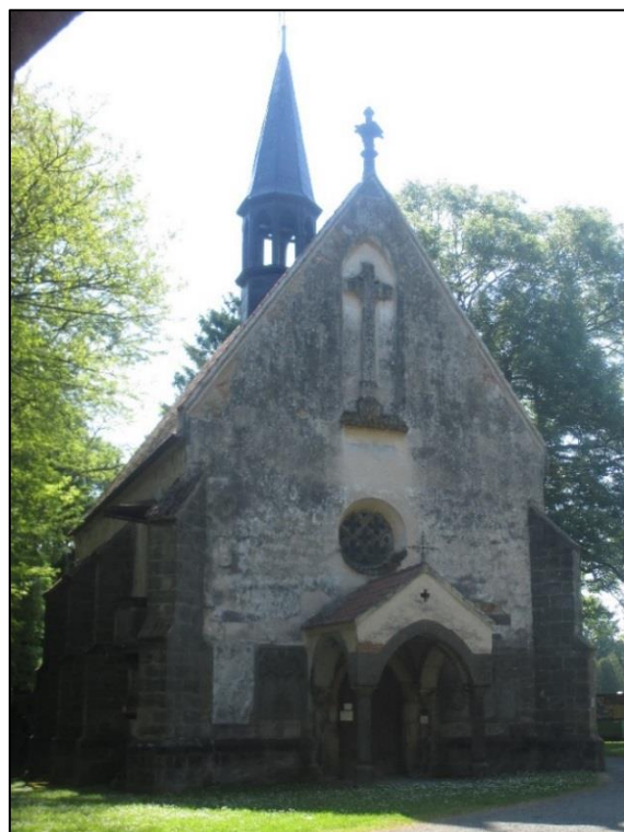
Obrázek č. 4: Kostel Povýšení sv. Kříže