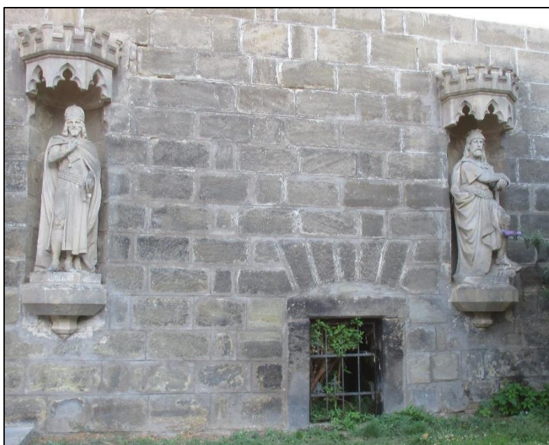
Obrázek č. 32: Socha císaře Karla IV. a knížete Břetislava I.