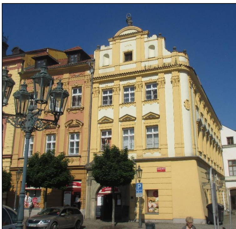
Obrázek č. 15: Khomovský dům