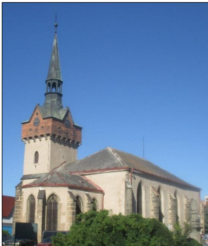
Obrázek č. 5: Kostel sv. Kateřiny