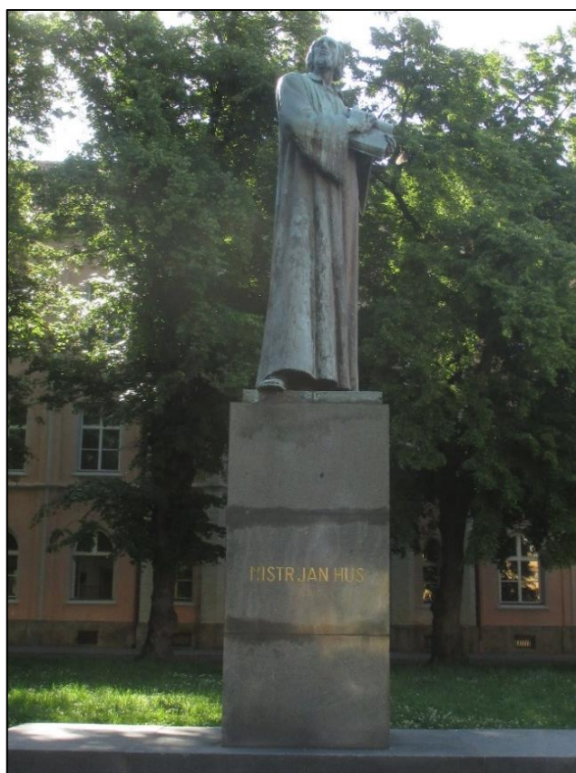
Obrázek č. 28: Pomník Mistra Jana Husa