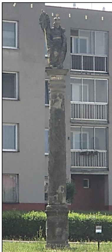
Obrázek č. 31: Viniční sloup se sochou sv. Václava