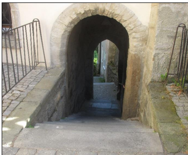
Obrázek č. 12: Pardubická fortna