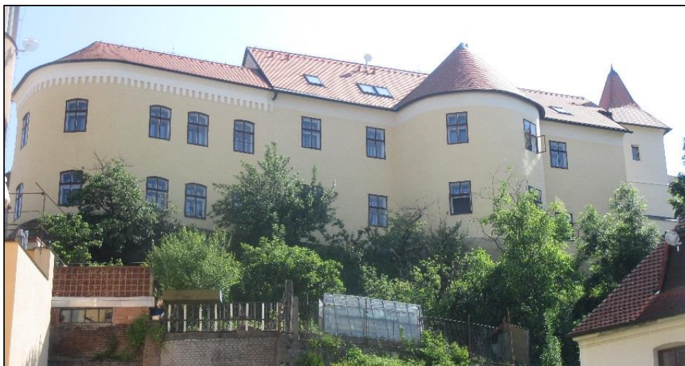
Obrázek č. 13: Dům Na Puši