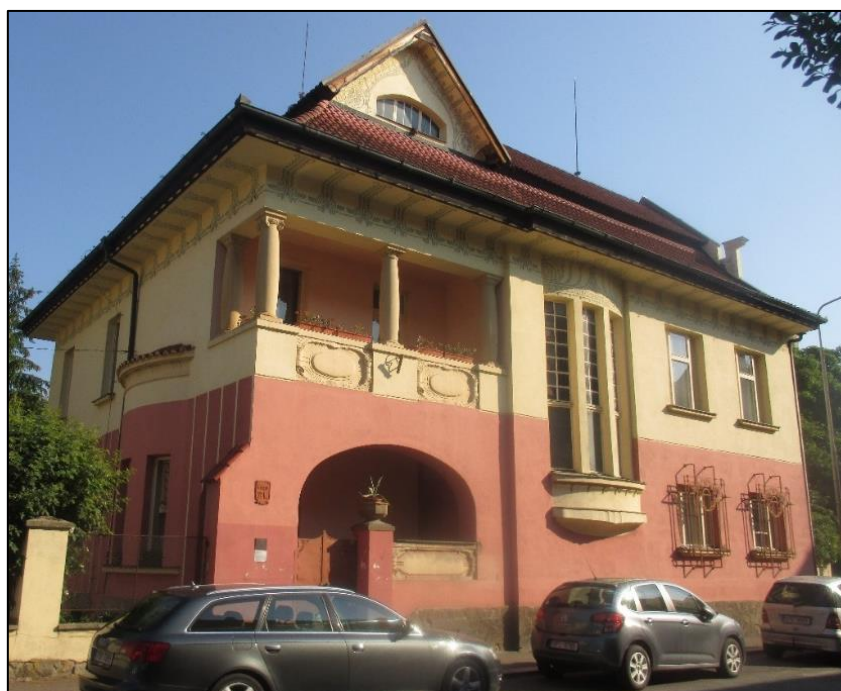
Obrázek č. 16: Kotěrova vila