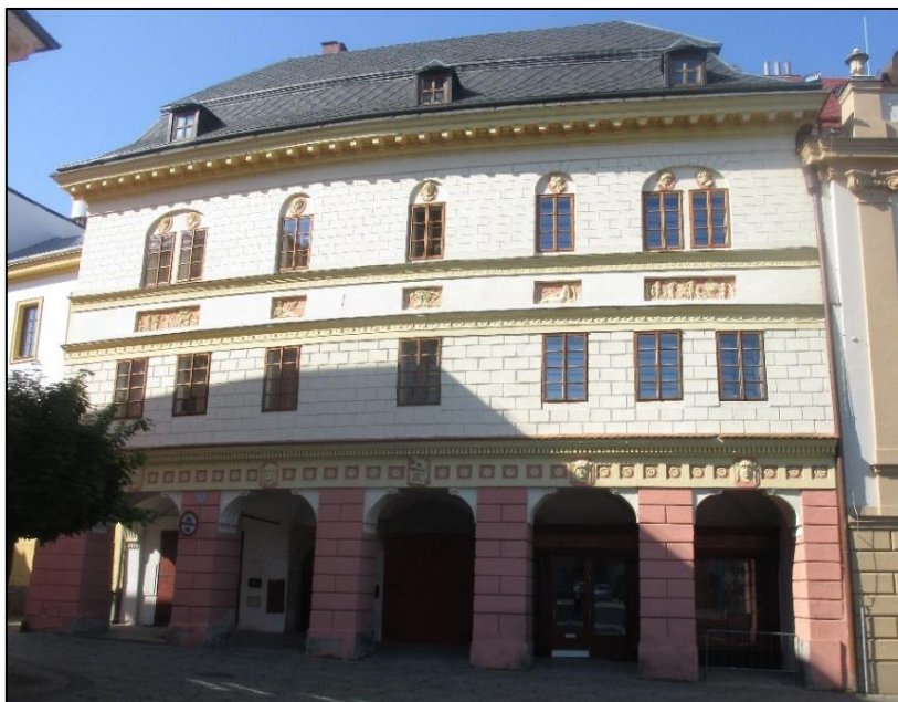
Obrázek č. 24: Rozvodovský dům