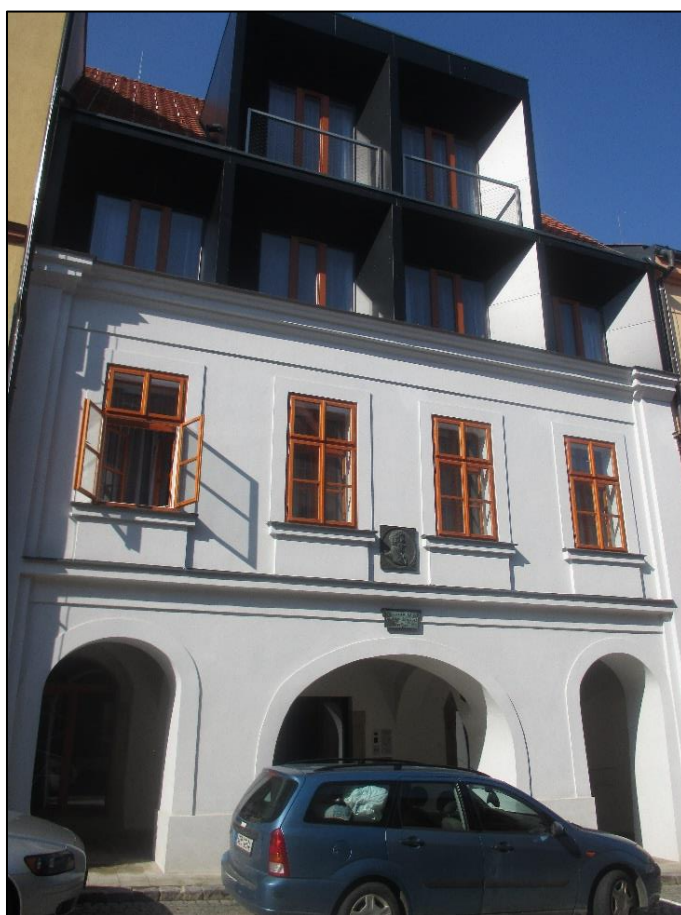
Obrázek č. 22: Rodný dům Jana Nepomuka Štěpánka