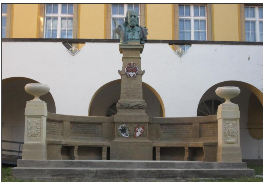
Obrázek č. 30: Pomník Viktorina Kornela ze Všehrd