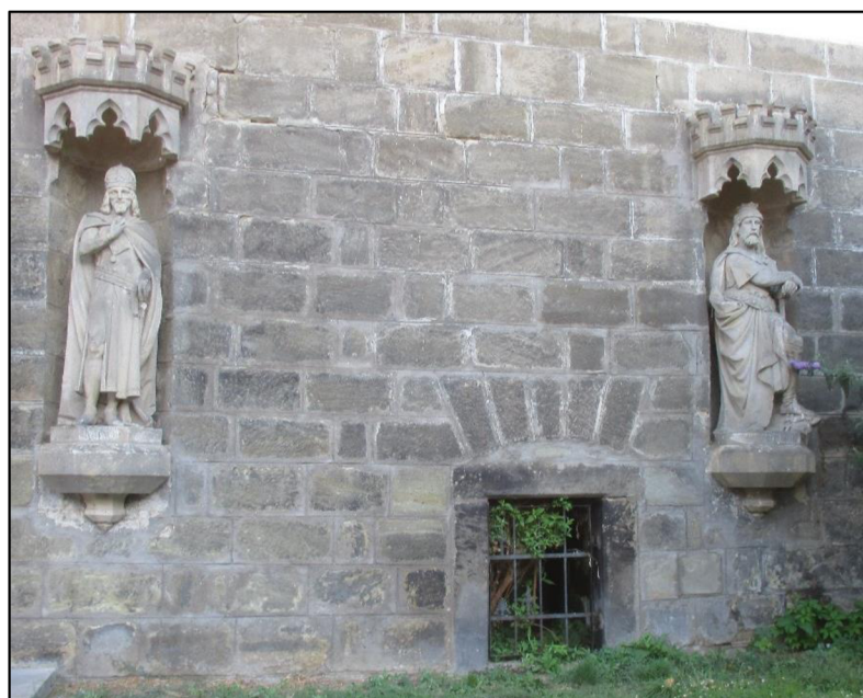
Obrázek č. 32: Socha císaře Karla IV. a knížete Břetislava I.