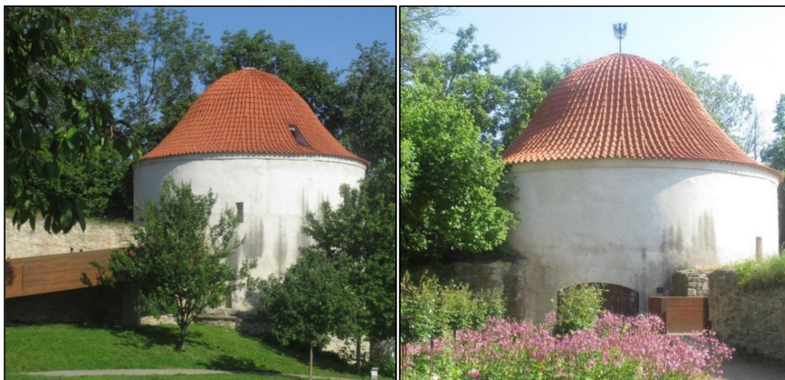
Obrázek č. 10: Bašta Prachárna