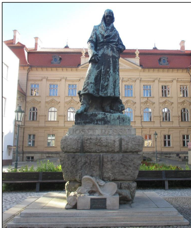
Obrázek č. 29: Pomník Josefa Ressela