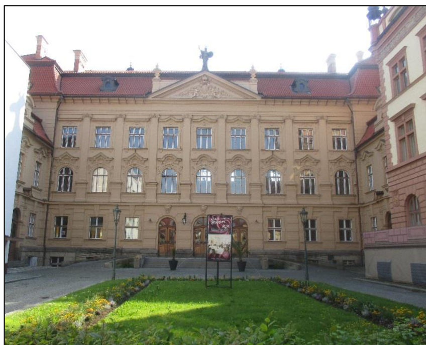
Obrázek č. 9: Regionální muzeum (neobarokní budova)