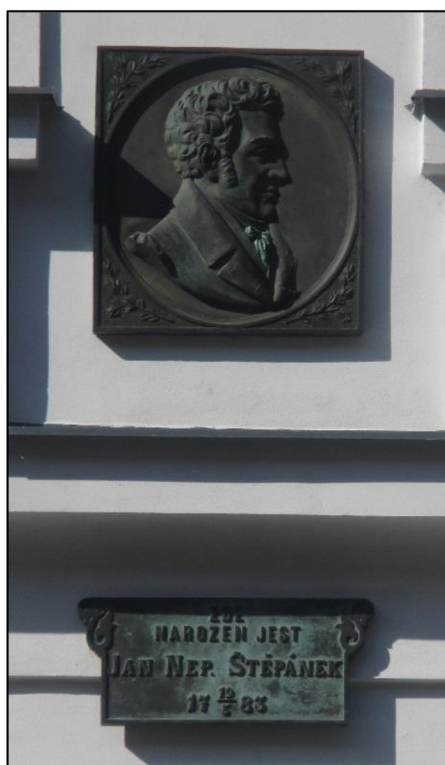
Obrázek č. 23: Rodný dům Jana Nepomuka Štěpánka (pamětní deska)