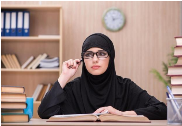
Obrázek 2. Dostupné z:

https://media.super.cz/images/gallery/0000000007990552/jnj3fsbxgv2egQT3f1bGLw/50cddd04397e00830d250600-45985?size=539