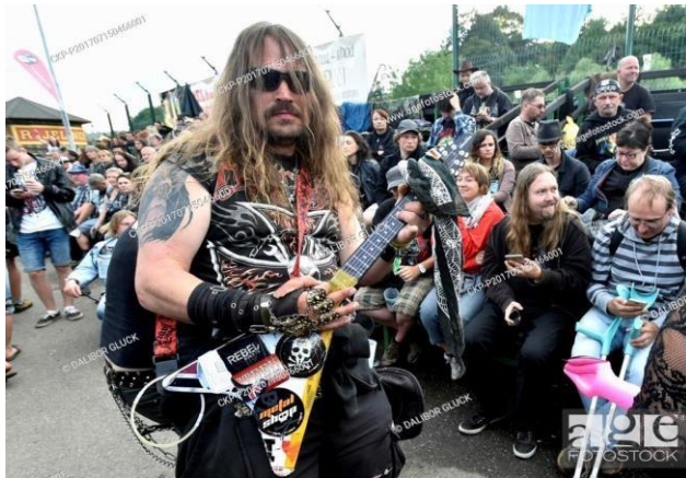
Obrázek 5.