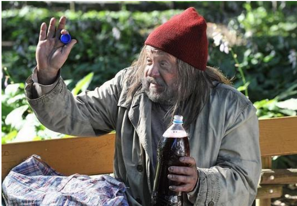
Obrázek 1.