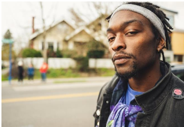
Obrázek 6.