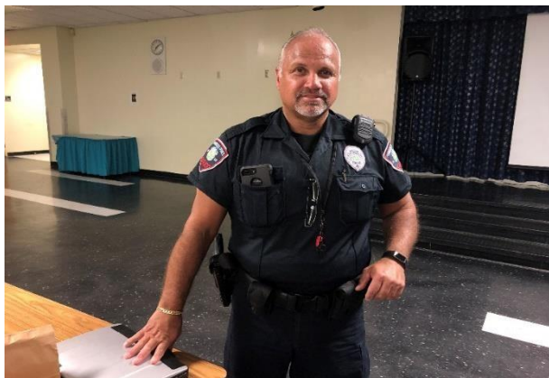
Obrázek 3.