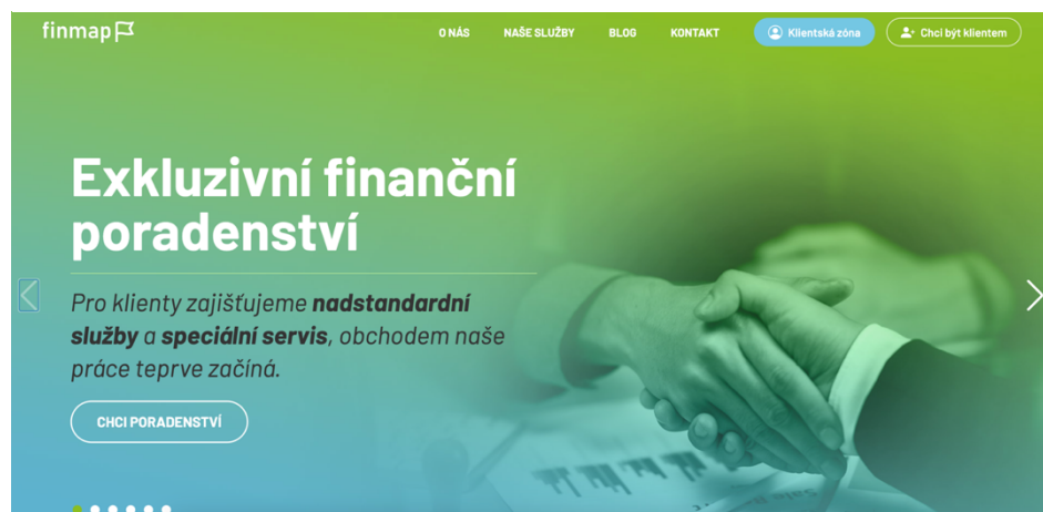
Obrázek 1 Webová stránka finmap.cz

Jedním prvků marketingové strategie Finmap.cz jsou jejich webové stránky, které jsou popsány jako vizuálně atraktivní a informativní. Kvalitně navržené webové stránky mohou sloužit jako efektivní nástroj pro přilákání nových klientů, poskytování podrobných informací o nabízených službách a usnadnění prvního kontaktu. Dobře strukturované a snadno navigovatelné webové stránky rovněž odrážejí profesionalitu a důvěryhodnost firmy, což je klíčové pro získávání důvěry potenciálních klientů.