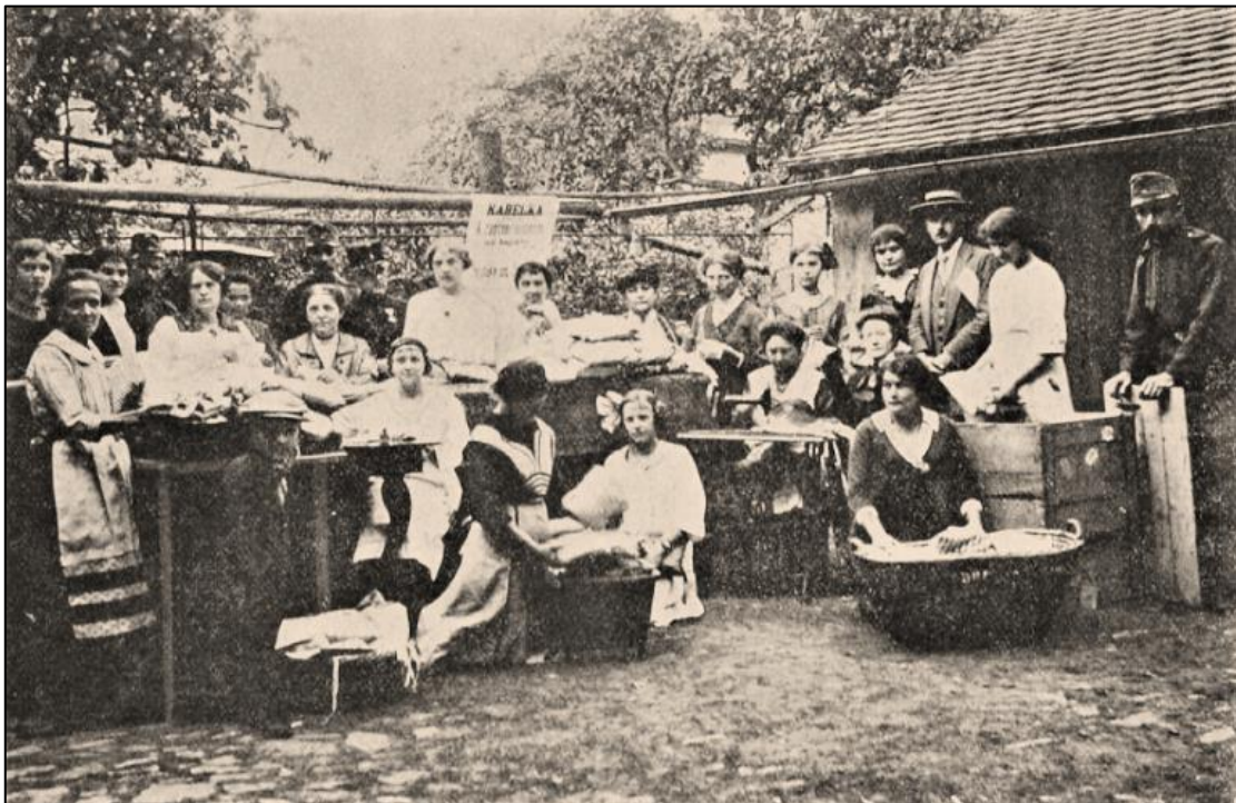
Obrázek 6: Kutnohorské dámy