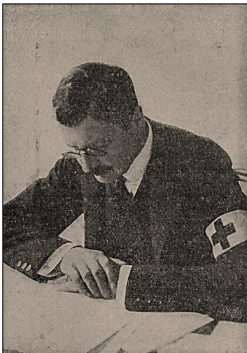
Obrázek 1: Hrabě Ervín Nostic, prezident Zemského pomocného spolku Červeného kříže pro Království české