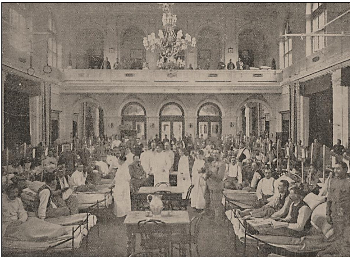
Obrázek 8: Rezervní vojenská nemocnice v Mladé Boleslavi zřízená v místnostech Sokola