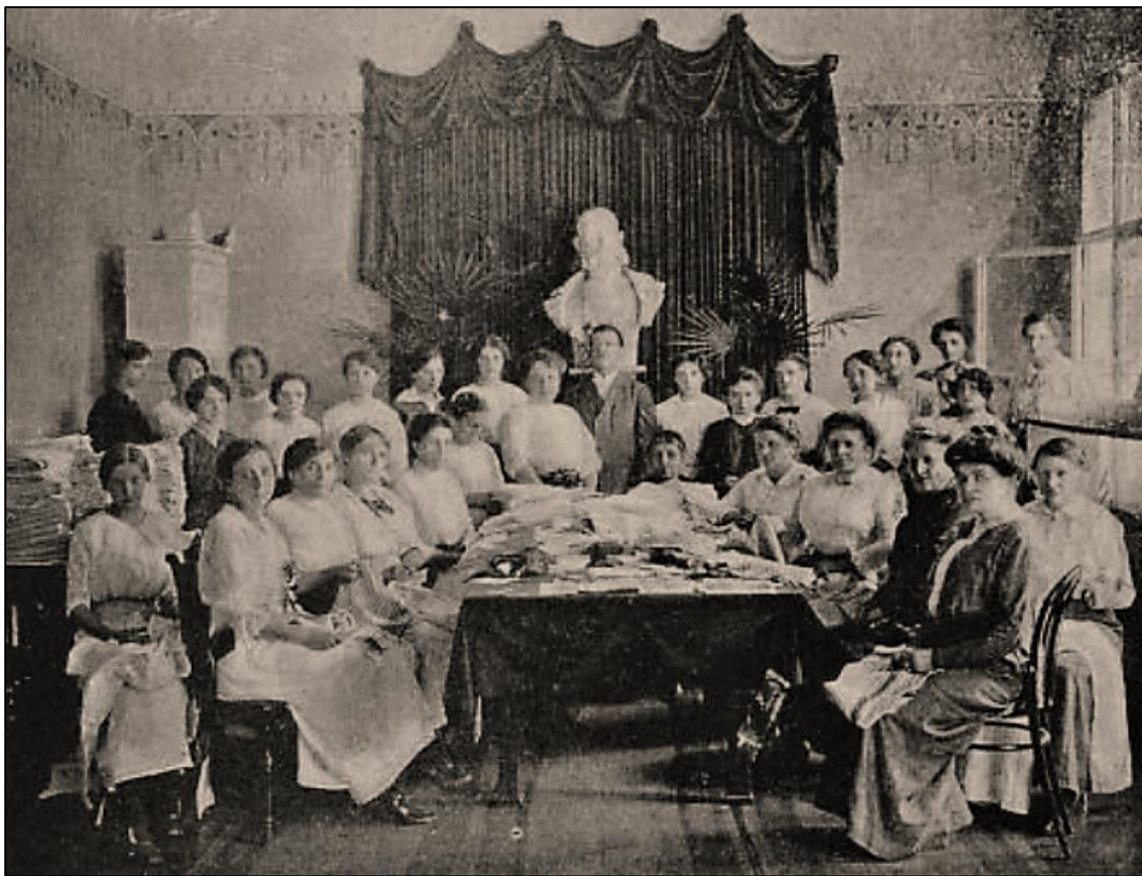
Obrázek 7: Ženský odštěpný pomocný spolek v Turnově