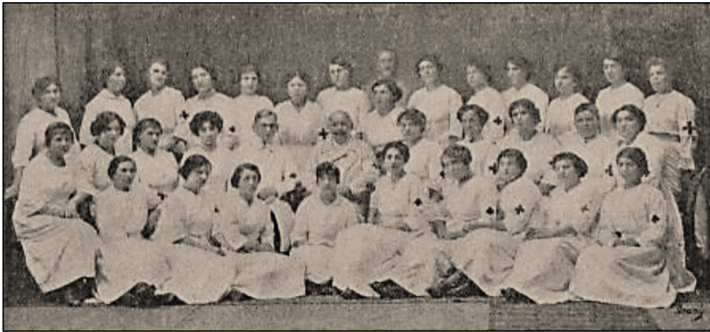
Obrázek 5: Účastnice ošetrovatelského kurzu v Novém Bydžově