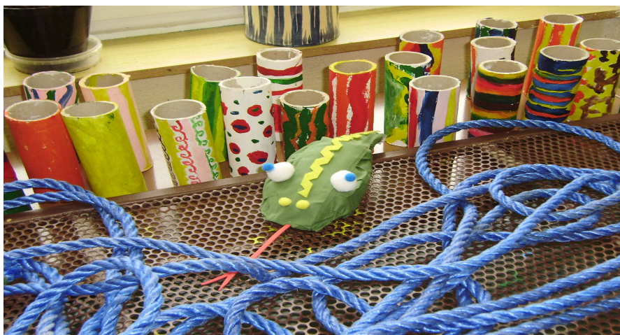
Obr. 5, 6