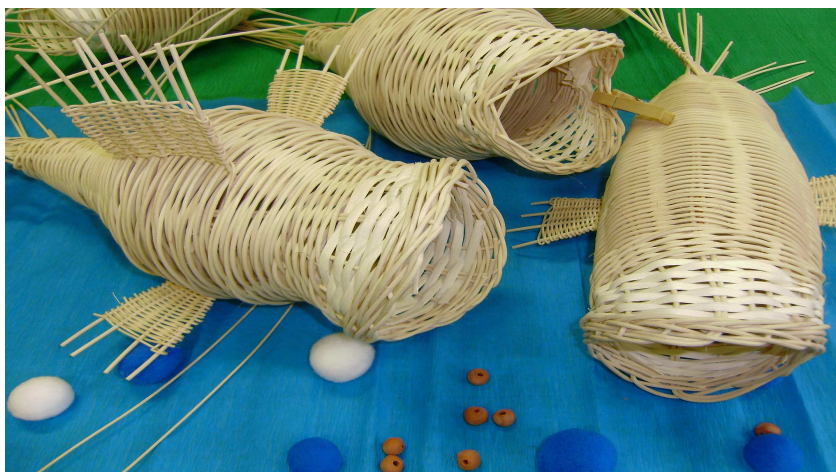
Obr. 10, 11