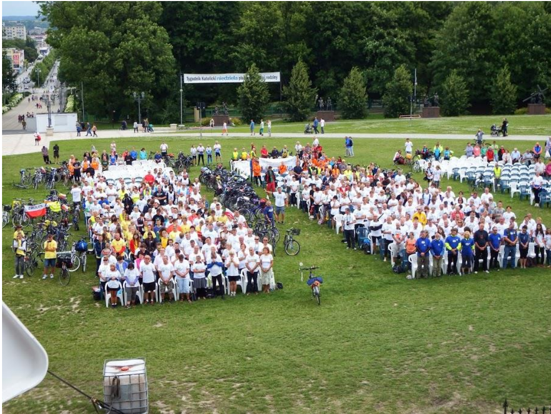
Obrázek 3. Pout' na kole, Zdroj: ( http://rowerowa.info/ )

Zdroj: zpracování vlastní podle Google.com