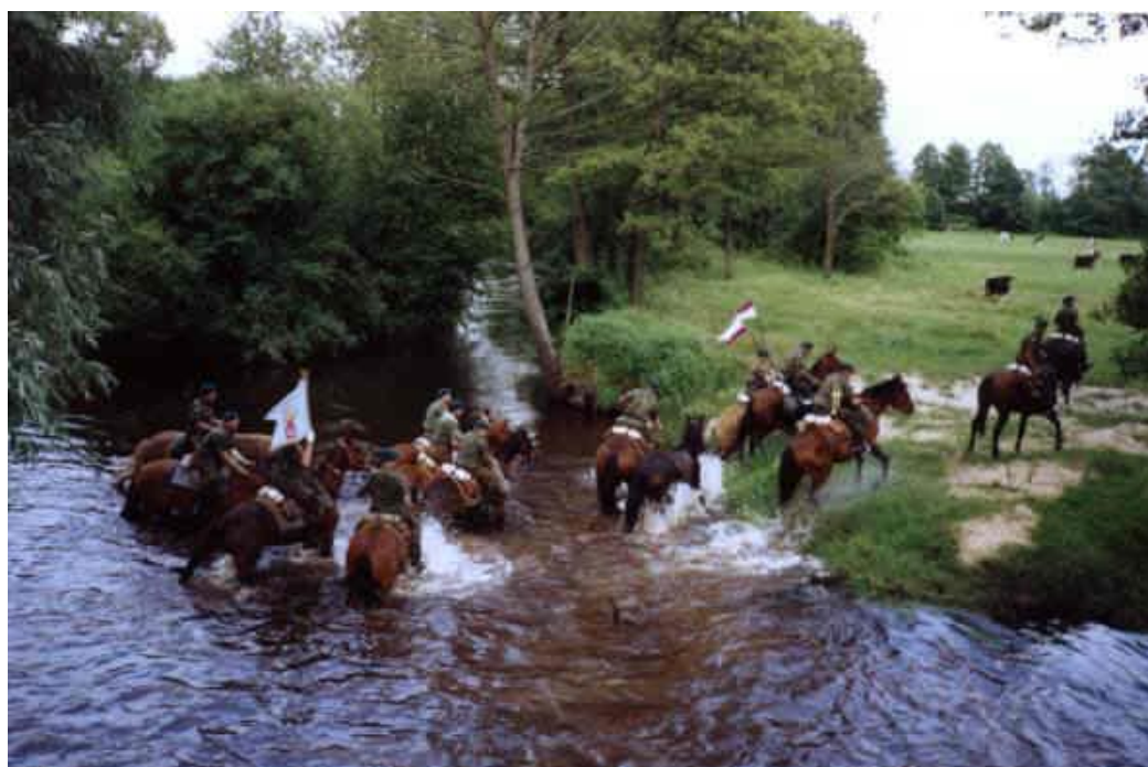
Obrázek 5. Koňská pouť ze Zareby Koscielne na Jasnou Goru a do Czestochova Zdroj: ( http://www.gimzareby.neostrada.pl/kawaleria_pielgrz.htm#XI Konna )

Stejně tak jsem nezaznamenala prozatím žádnou událost koňských poutí na rok 2015 v Polsku. V uplynulých letech ale ano. Jsou jim například poutě ze Zareby Koscielne na Jasnou Goru a do Czestochova. Poslední se však konala 29 června až 12 července 2010. Jelo se 11 dní 450 kilometrů. V průměru na den to vycházelo 30-45 kilometrů. V kamionu s přívěsem jezdí krmivo pro koně. Na den potřebují 8 kg sena a 5 kg ovsa. ( http://www.gimzareby.neostrada.pl/kawaleria_pielgrz.htm#XI Konna )