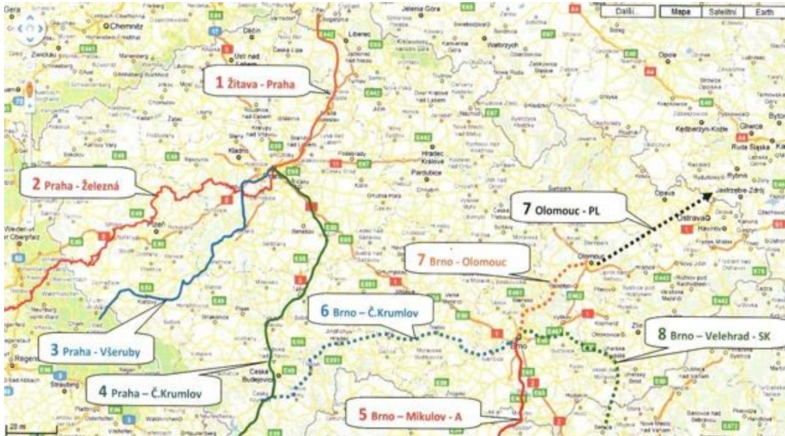
Obrázek 2. Jakubské cesty v Česku ( www.jakubskacesta.cz )

( http://www.jakubskacesta.cz/jakubske_cesty/v_cesku )