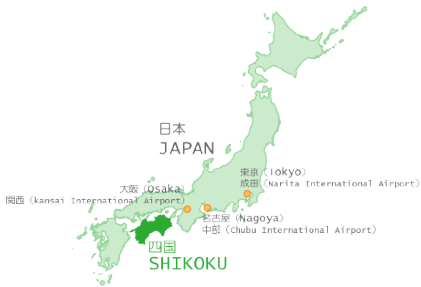
Obrázek 7. Ostrov Shikoku