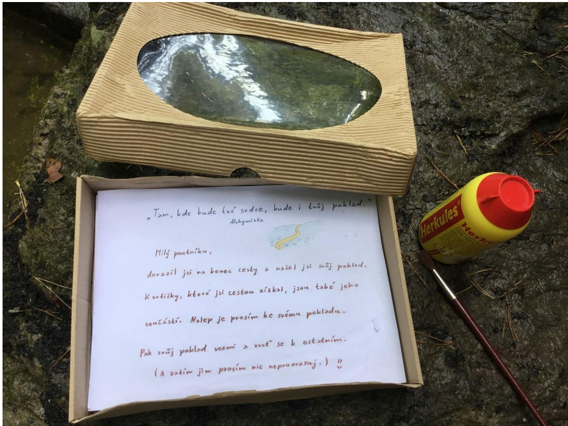
Sedmé zastavení – poklad