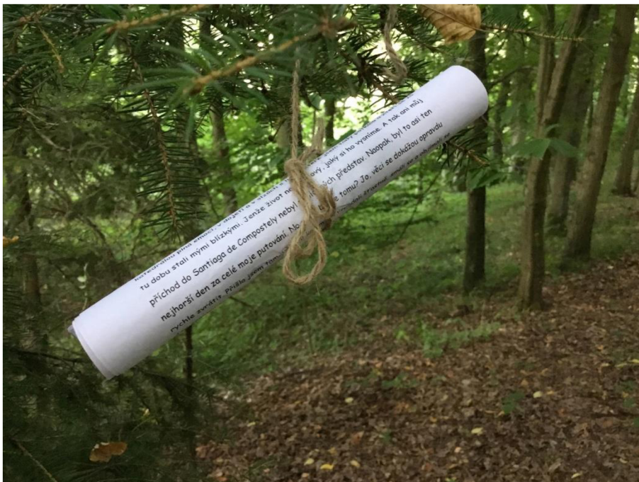
První zastavení – dopis poutnice ze Svatojakubské cesty