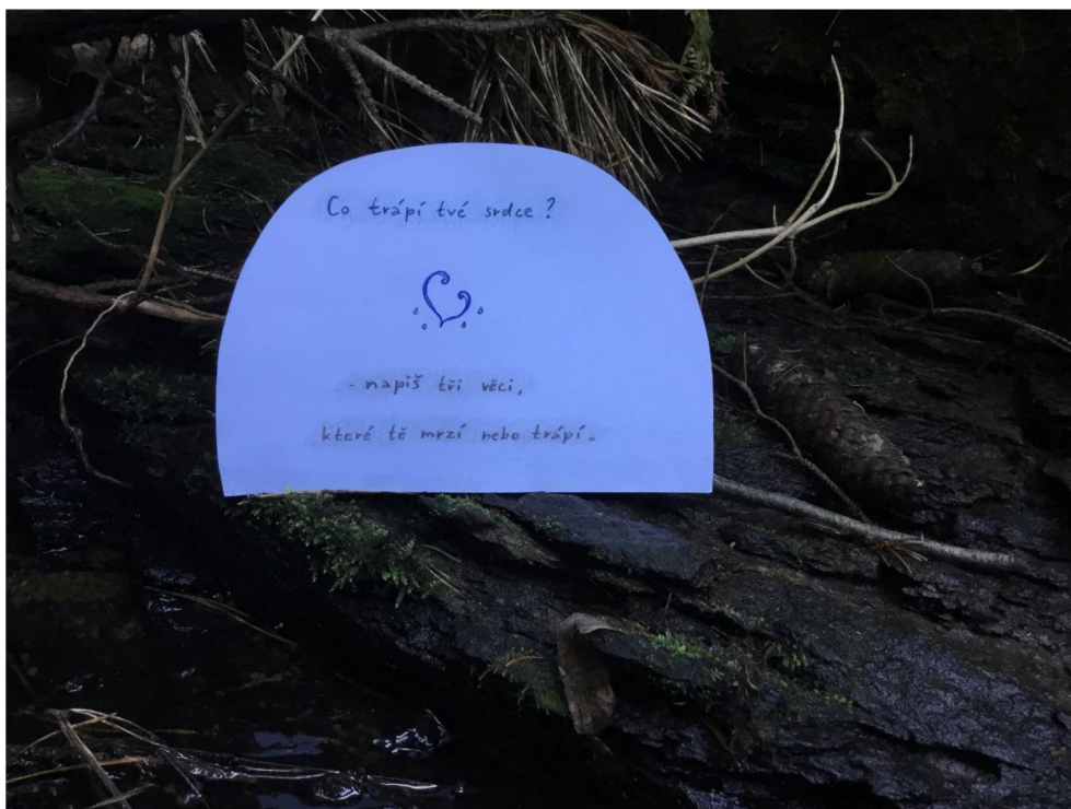
Třetí zastavení – otázka pro poutníky