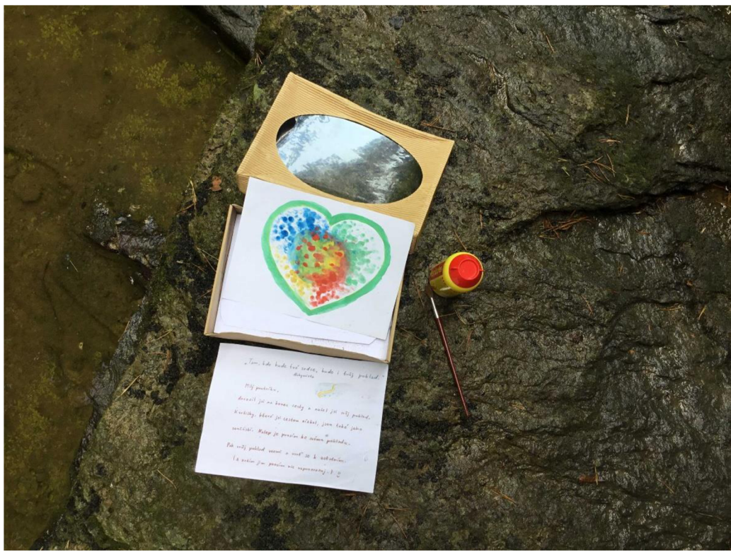
Sedmé zastavení – poklad po otevření (výtvar autorky práce namalovaný během programu)