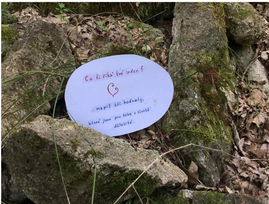
Druhé zastavení – první otázka pro poutníky