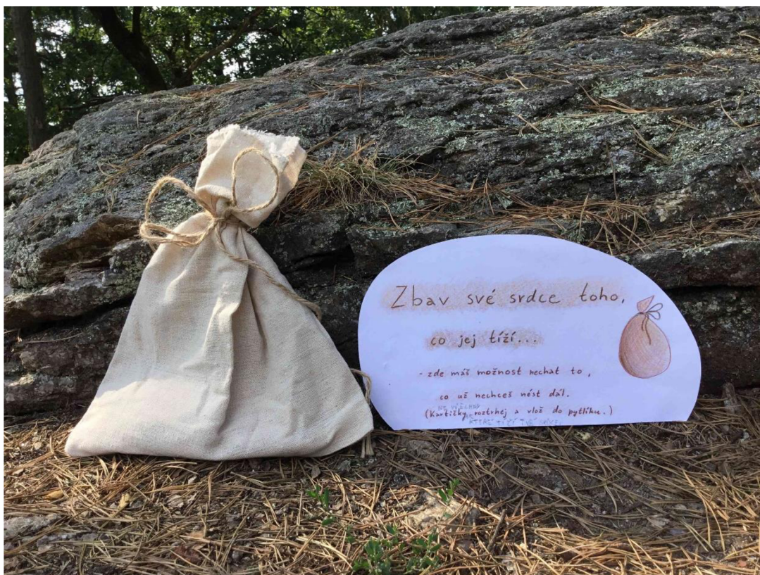
Šesté zastavení – zbav své srdce toho, co jej tíží – možnost zanechat vybrané kartičky