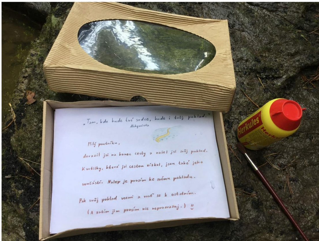
Sedmé zastavení – poklad