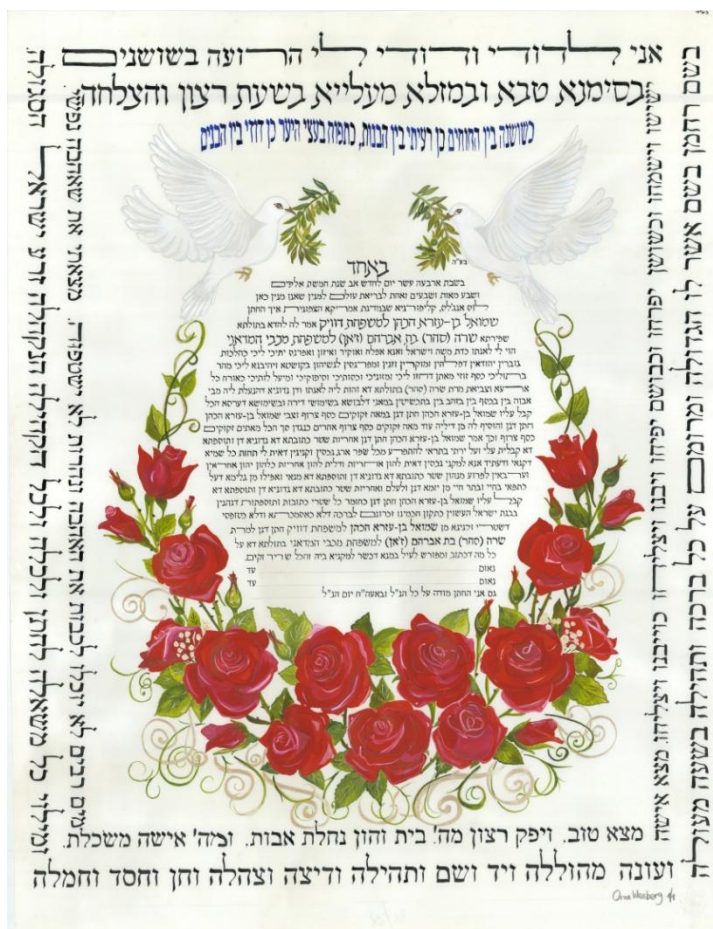
Obrázek 1: Židovská svatební smlouva - KETUBA