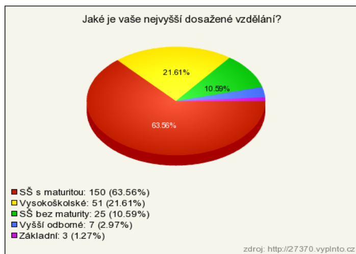
Garf 1: Složení respondentů dle stupně dosaženého vzdělání