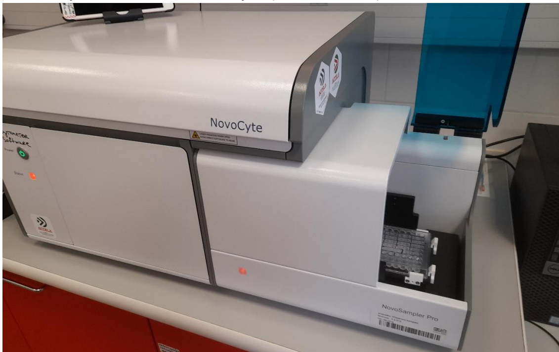
Obrázek 2: Moderní průtoková cytometrie.

laboratoři řadu výhod. Velký počet buněk lze vyhodnotit (10 000 za vzorek) během krátké doby (1 min) a mnohočetné organely jednotlivých spermií vyhodnocovat naráz (Garner a kol.1994). Životaschopnost spermií a VCL prokázaly významnou, i když omezenou prediktivní kapacitu na plodnost (Santolaria a kol. 2015). Procento životaschopných buněk, stanovené průtokovou cytometrií, se zdá být nepřiměřenějším laboratorním testem korelujícím s plodností (Wilhelm a kol. 1996). Procento živých buněk detekovaných průtokovou cytometrií koreluje ( r=0,68 ) s plodností hřebce (Wilhelm a kol. 1996). Korelace mezi celkovým počtem životaschopných spermií v inseminační dávce a polní plodností je nízká, ale významná ( r = 0,051 , P = 0,016 ), což naznačuje, že hodnocení integrity plazmatické membrány může sloužit jako nákladově výhodná metoda kontroly kvality zmrazených a rozmražených inseminačních dávek býků (Alm a kol. 2001).