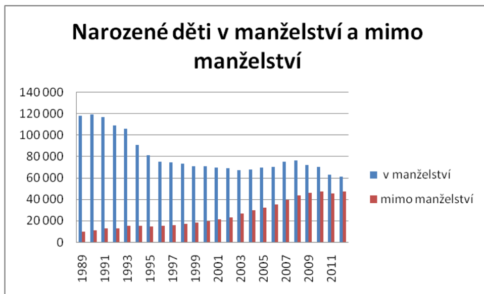
Graf č. 2 – narozené děti v manželství a mimo ně 69

Na grafu č. 2 můžeme porovnat počet narozených dětí v manželství a ve volném soužití párů.