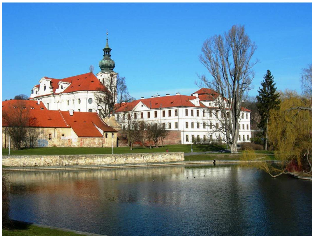
Obr. 4 Benediktinské opatství sv. Václava v Broumově, pohled přes řeku Stěnavu