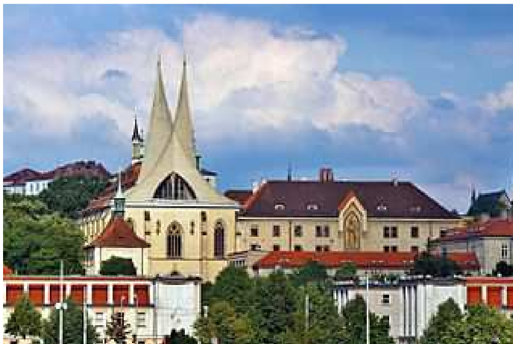
Obr. 8 Kostel Svatého Mikuláše na Starém Městě pražském, 1635 až 1787 benediktinské opatství