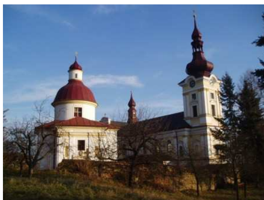
Obr. 14 Pustiměř (Převzato ruinen. URL: http://www.ruinen.cz/benediktini/pustimer1.jpg )