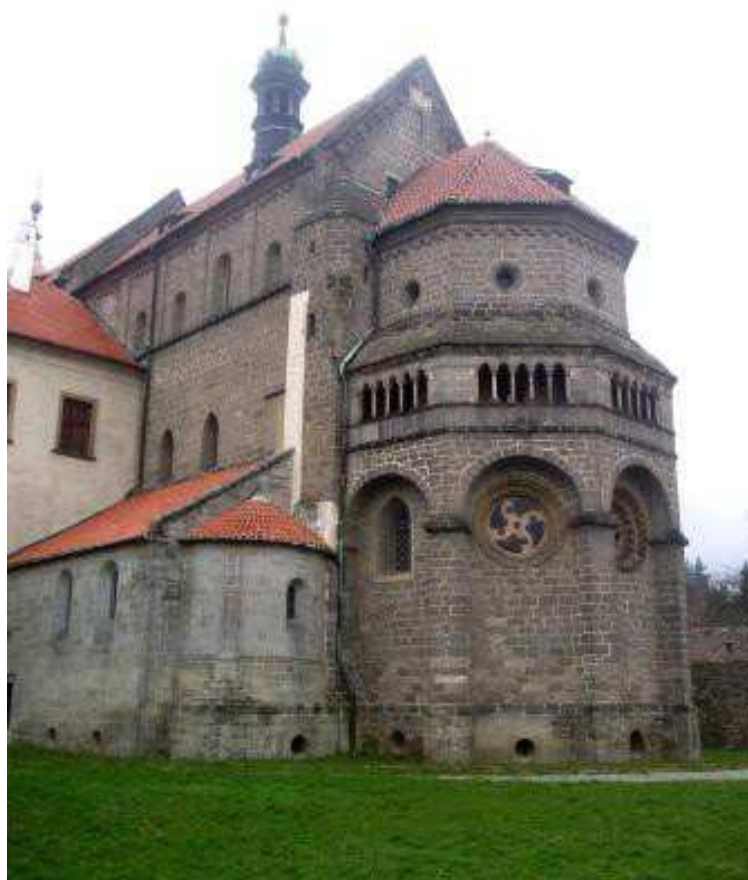
Obr. 14 Pustiměř