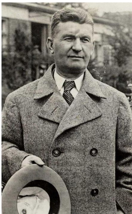
1. Tomáš Baťa