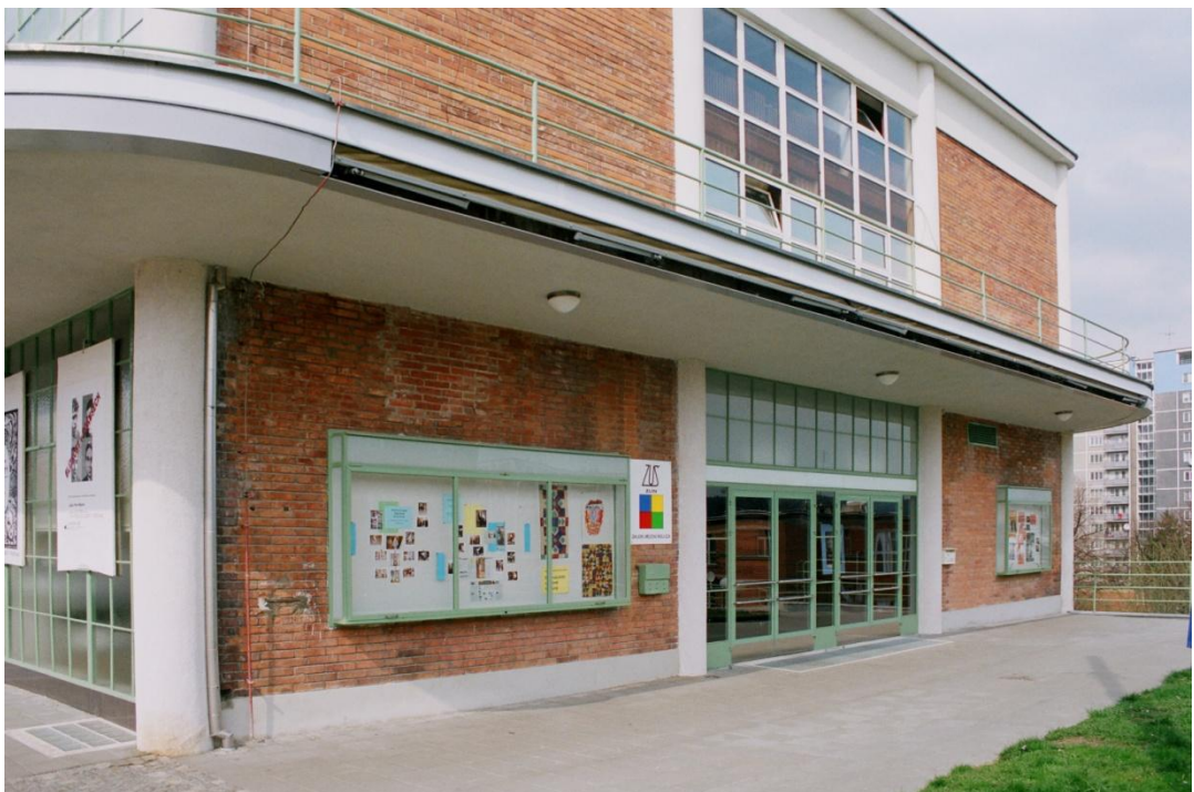
16. Hlavní vchod do ZUŠ Fotoarchiv školy