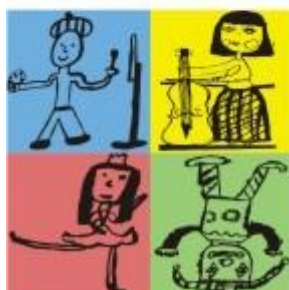
20. Logo školy

http://www.zuskazuska.cz/products/zus-zlin-ctyrbarevna-skola/