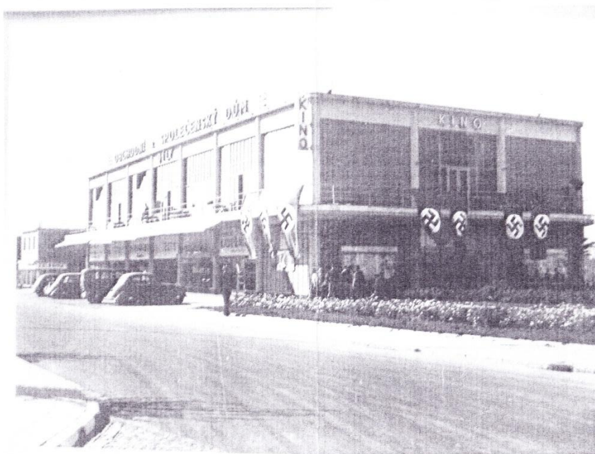
13. Budova školy v době okupace