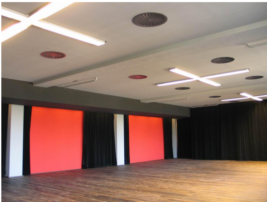
17. Komorní sál