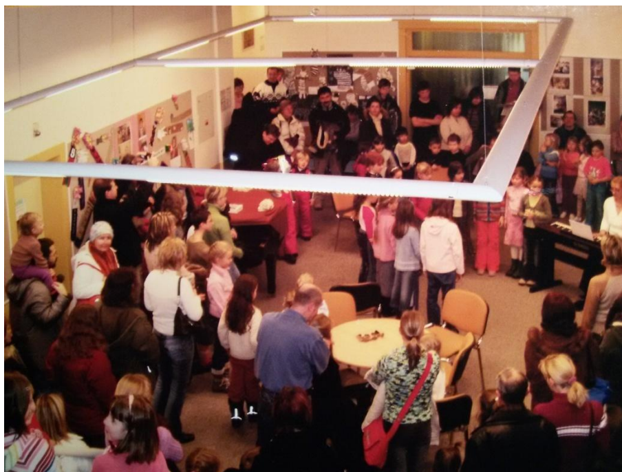
19. Vernisáž ve foyer školy

Výstředková kronika ZUŠ z let 2005 – 2006