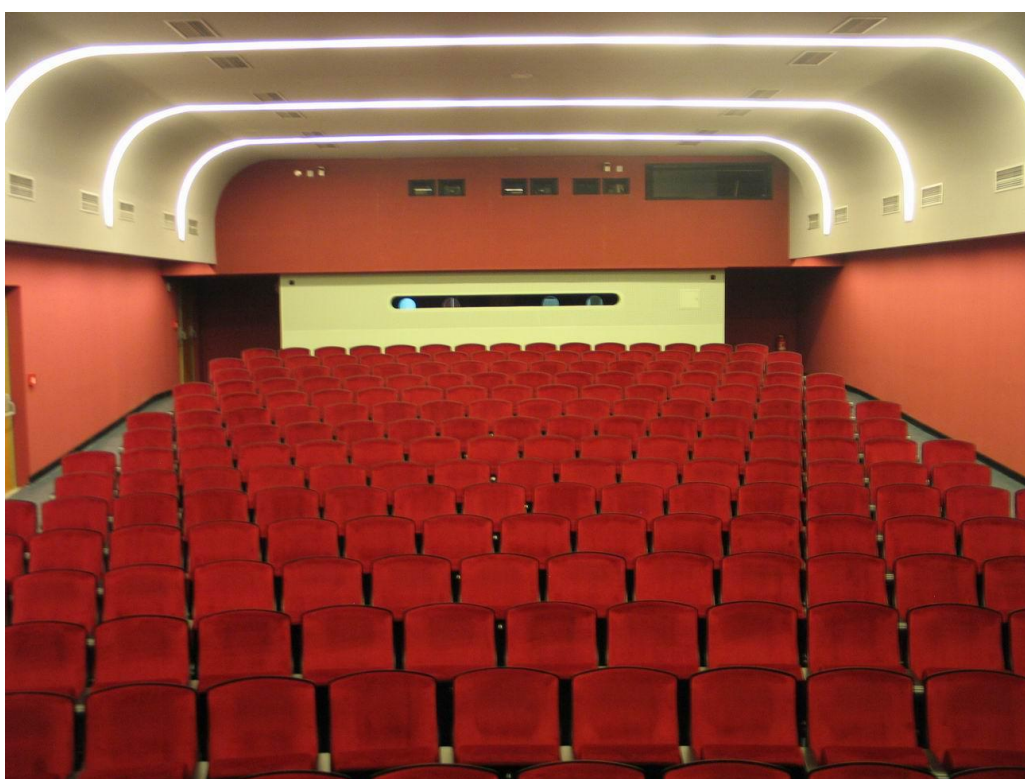
18. Sál Malé scény