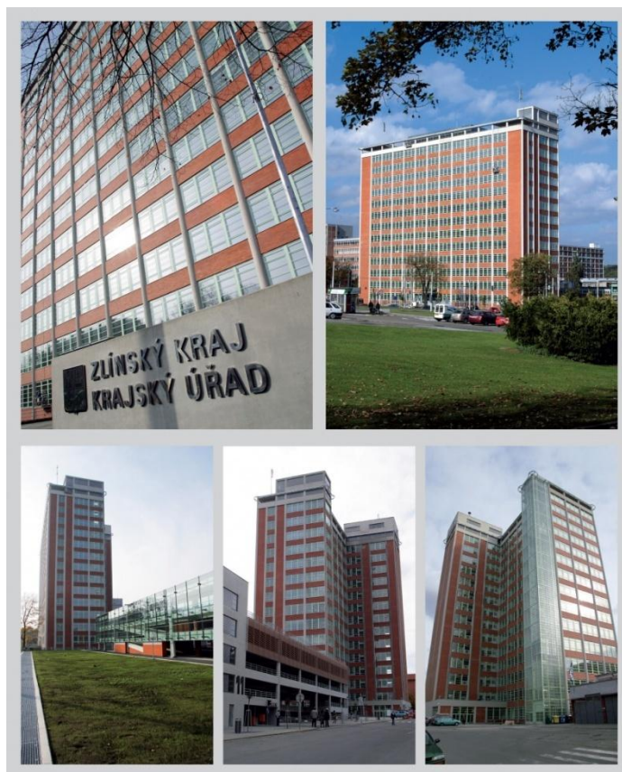
5. Svit 21. budova

http://www.s-projekt.cz/cz/reference/administrativa/spravni-budova-c-21-zlin/