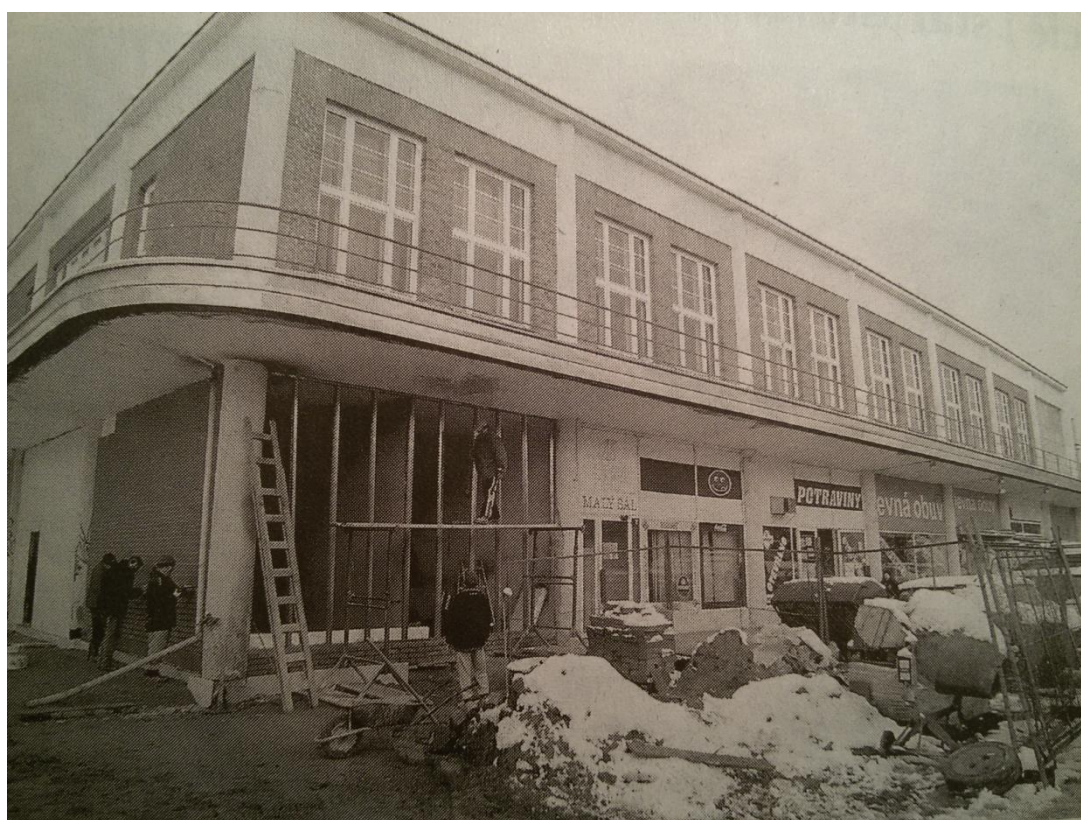
14. Oprava Malé scény Výstřižková kronika ZUŠ z let 2005 – 2006 (MF Dnes 2. prosince 2005)