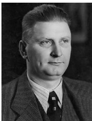
2. Jan Antonín Baťa

http://batastory.net/cs/milniky/jan-antonin-bata