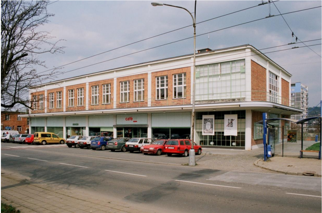
15. Budova ZUŠ – současnost