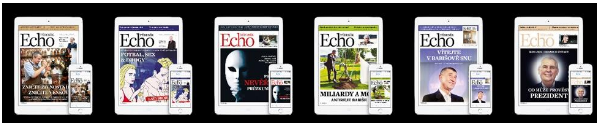
Obrázek č. 1 79

Na první pohled je zřejmé, že volba fotografií na titulních stranách týdeníku Téma je opozicí k týdeníku Echo. Znamou osobnost vedení týdeníku na titulní stranu umístilo jen u čísla 4, 28, 30 a 34. U čísla 4 je vyobrazen hudebník Karel Kryl, číslo 28 zobrazuje Alberta Einsteina a Rudolfa Hrušínského staršího, jako vojáka Švejka, v čísle 30 je to Andrej Babiš s manželkou a na obálce čísla 34 můžeme vidět lékaře Pavla Koláře. Zbytek titulních stran je tvořen čistě tematicky. Tematickou formu obálek také dokreslují titulky či hesla, kterými se členové redakce v aktuálním čísle zaobírají. Horní okraj je stejně jako u Echa vyplněn upoutávkami na další dva články z časopisu, ovšem oproti Echu jsou zde kromě titulků i fotografie.