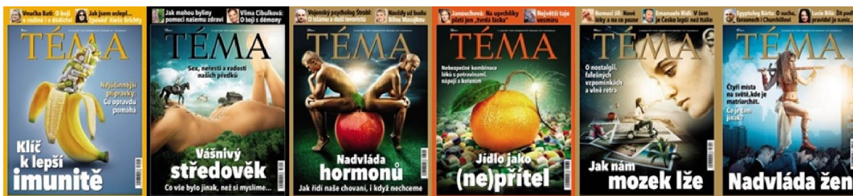
Obrázek č. 2 80

Ani jeden z týdeníků nemá titulní strany nijak barevně či obsahově přeplněné. Ovšem týdeník Echo může působit uhlazenějším a uspořádanějším dojmem, protože název časopisu je graficky oddělen od hlavní fotografie a nezasahuje do ní. U týdeníku Téma je její součástí, což může někdy působit nepřehledně. Náhledy všech obálek z roku 2017 jsou součástí příloh.