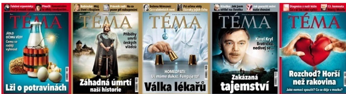
Příloha č. 4: Titulní strany časopisu Téma v roce 2017