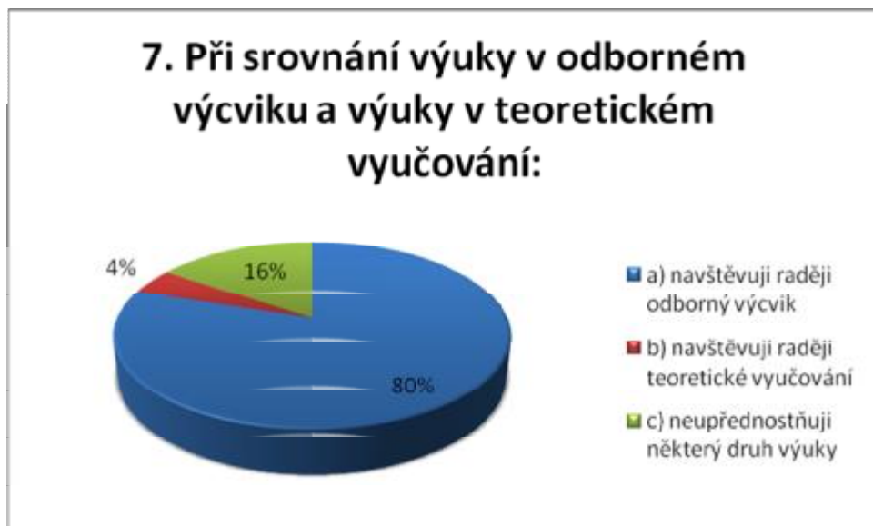
Graf č. 3

8. Myslíte si, že počet hodin OV je pro Vás dostačující?