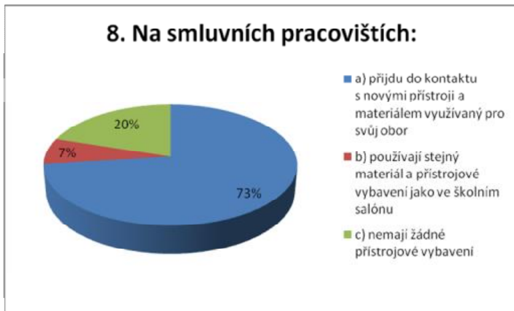
Graf č. 5

9. Při srovnání výuky odborného výcviku probíhající ve školním salonu a výuky probíhající na smluvním pracovišti: