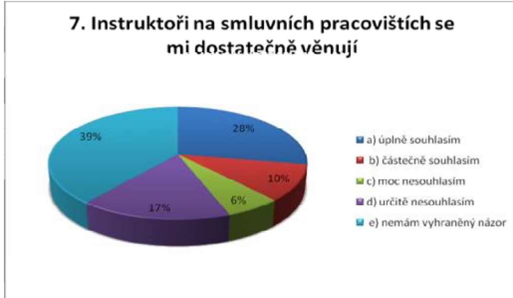
Graf č. 4