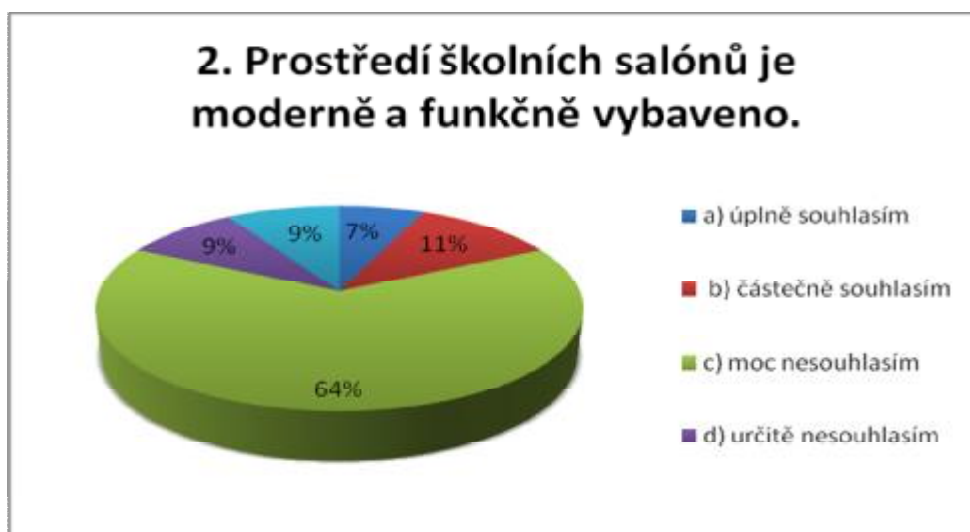
Graf č. 1

V této otázce se vyjádřili žáci většinou záporně a moc nesouhlasí s tvrzením, že jsou učebny moderně a funkčně vybaveny, pouze někteří žáci, jsou s pracovištěm pro odborný výcvik celkem spokojeny, odpovědi na tuto otázku jsou dosti alarmující (viz graf č. 1).