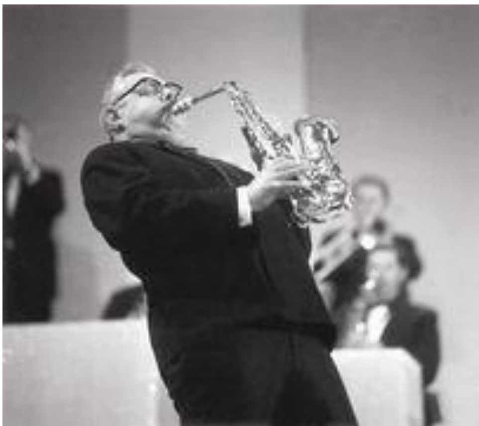
Obrázek 3: Karel Krautgartner