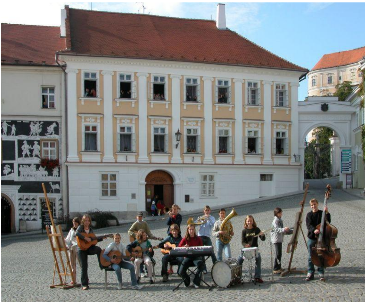
Obrázek 1: ZUŠ Mikulov