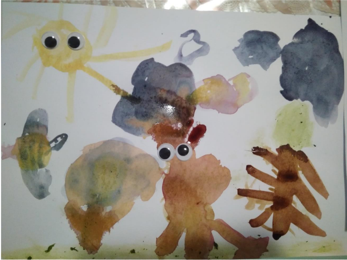
Příloha č. 4: Obrázky z přírodních barev