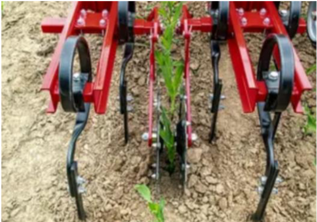
Obr. 4 Záběr meziřádkové plečky s pomocnými krojícími válci.

Příkladnými plečkami mohou být čepele sestavené na principu kachních nožek, které bývají namontovány na pevných či pružných násadcích, které většinou bývají sestaveny v počtu 3 až 5 násad na sekci, které zajišťují co nejvyšší efekt plečkování.