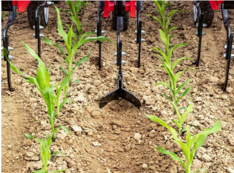
Obr. 5 Foto meziřádkové plečky s pomocnou hrůbkovací radličkou.

řádku a za pomoci hydraulicky řízených pleček dokáží následně provést meziřádkovou kultivaci s co největším přiblížením ke kulturním rostlinám, aniž by došlo k jejich poškození. Ukazuje se, že systémy automatického navádění pleček přinášejí zdokonalení provedení operace na rozdíl od klasických konvenčních metod užití pleček.