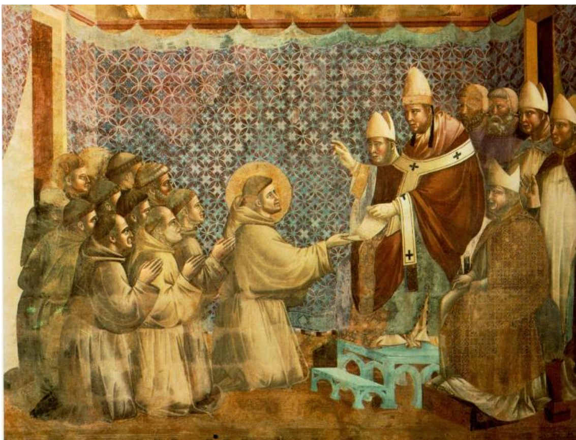
obrázek č. 5 – klíčové slovo: františkáni