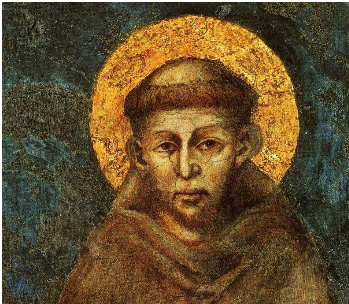
obrázek č. 4 – klíčové slovo: světec