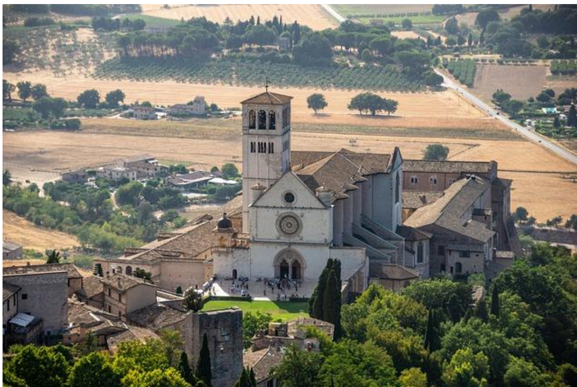
obrázek č. 2 – klíčové slovo: bazilika sv. Františka