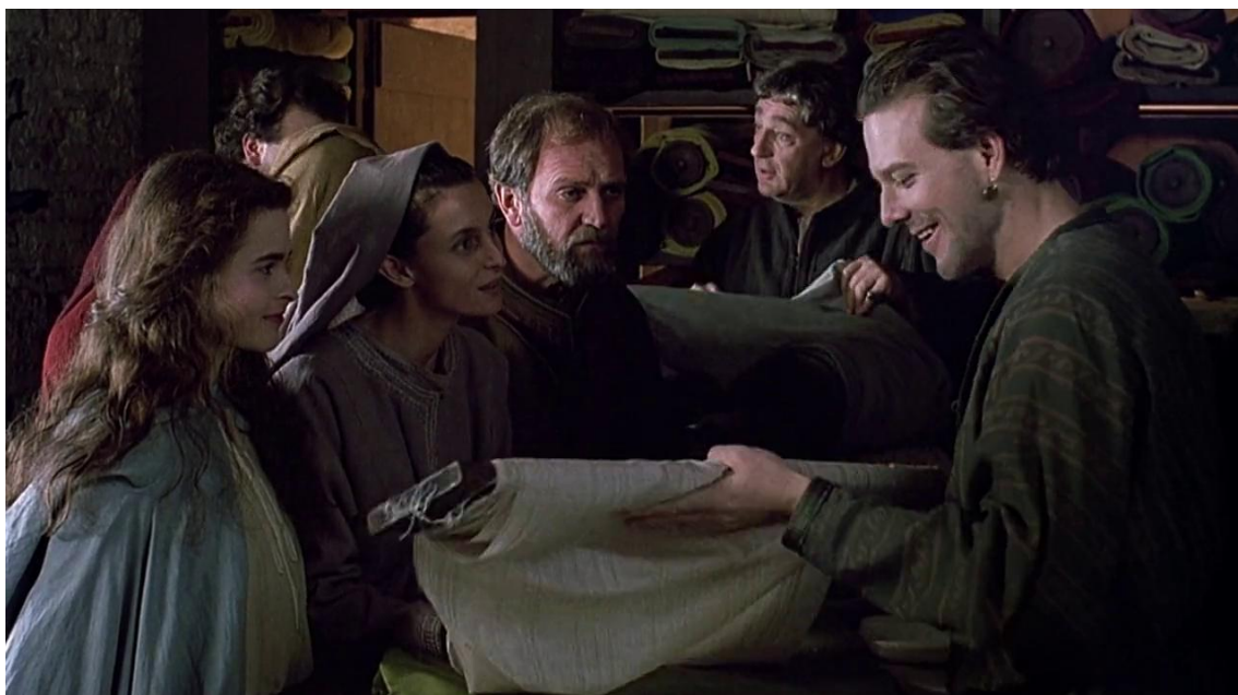
obrázek č. 3 – klíčové slovo: Francesco Bernandone