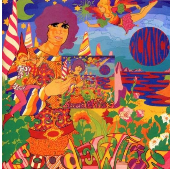
Afb. 3.4. Cover van de LP van Boudewijn de Groot 15

album. Maar het was te laat omdat concurrerende bands zoals Dragonfly en The Zipps verschenen (J.v.d. Plas 2008:51-53).