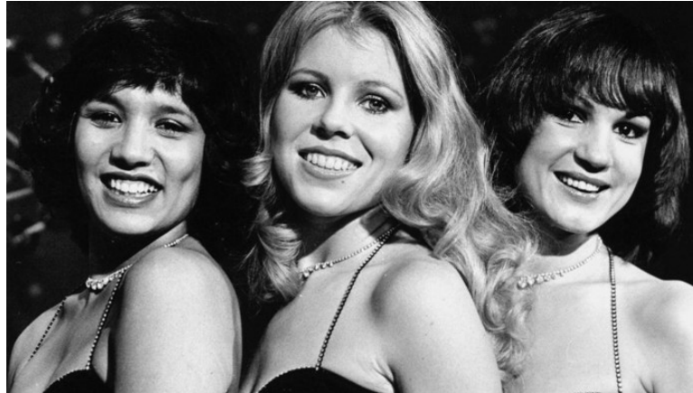
Afb. 3.5. Luv' 18

In de midden van de jaren zeventig begon in de rockmuziek een kloof tussen twee generaties te zijn. De generatie die bij bands opgroeide als Beatles en Rolling Stones, werd door een nieuwe generatie vervangen. Jonge mensen waren vooral geïnteresseerd in groepen die spectaculaire shows maakten met explosieven en stripteadanseres. De nieuwe tieners speelden hard rock of punk.