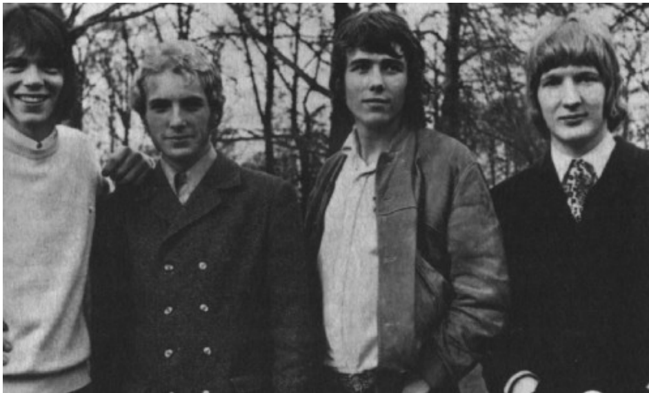
Afb. 3.3. The Golden Earrings 10