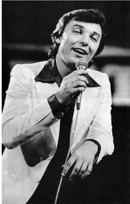
Afb. 2.1. Karel Gott 12

De normalisatie vernietigde de jonge Tsjechische cultuur en binnenlandse muziek. In de tweede helft van de twintigste eeuw werden pogingen ondernomen om Tsjechoslowakije te scheiden van de omliggende vrije wereld. Desondanks was er vaak een manier om deze verboden te omzeilen. Populaire muziek uit het buitenland kwam bij de Tsjechen via de import van grammofoonplaten of de afstemming op radiostations uit nabijgelegen staten. Natuurlijk werden er pogingen van de autoriteiten om deze radiostations te onderbreken, maar het was niet mogelijk geweest om dit te bereiken. Jongeren raakten steeds meer geïnteresseerd in buitenlandse populaire muziek. Ze verwachtten van deze muziek meer dan hun ouders. Interesse werd naar een nieuw soort populaire muziek verplaatst, en dat was rockmuziek.