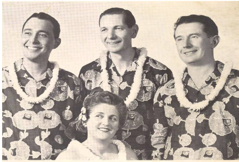
Afb. 3.1. Kilima Hawaiians 1