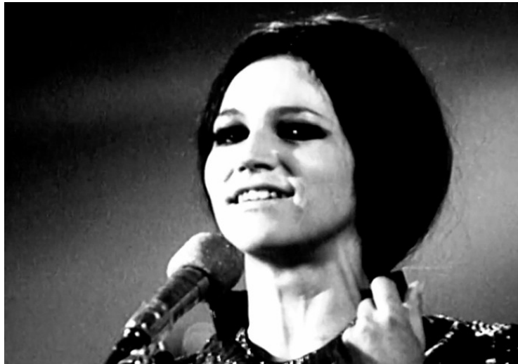
Afb. 2.2. 16 Marta Kubišová zingt haar lied Cesta in het jaar 1968 op het festival Bratislavská lyra.