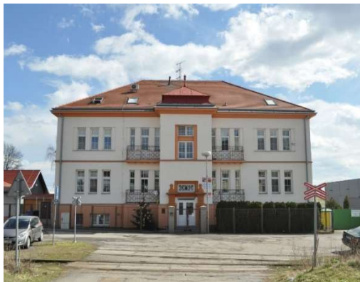
Budova Hakenova 18 55