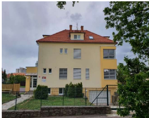
Budova Na Návrší 3 56