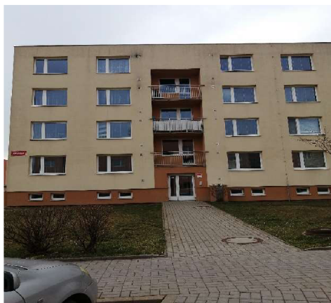
Byt v Příměticích, Krylova 1 57