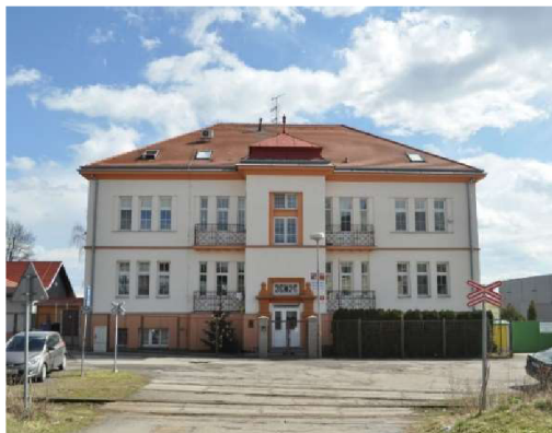
Budova Hakenova 18 55