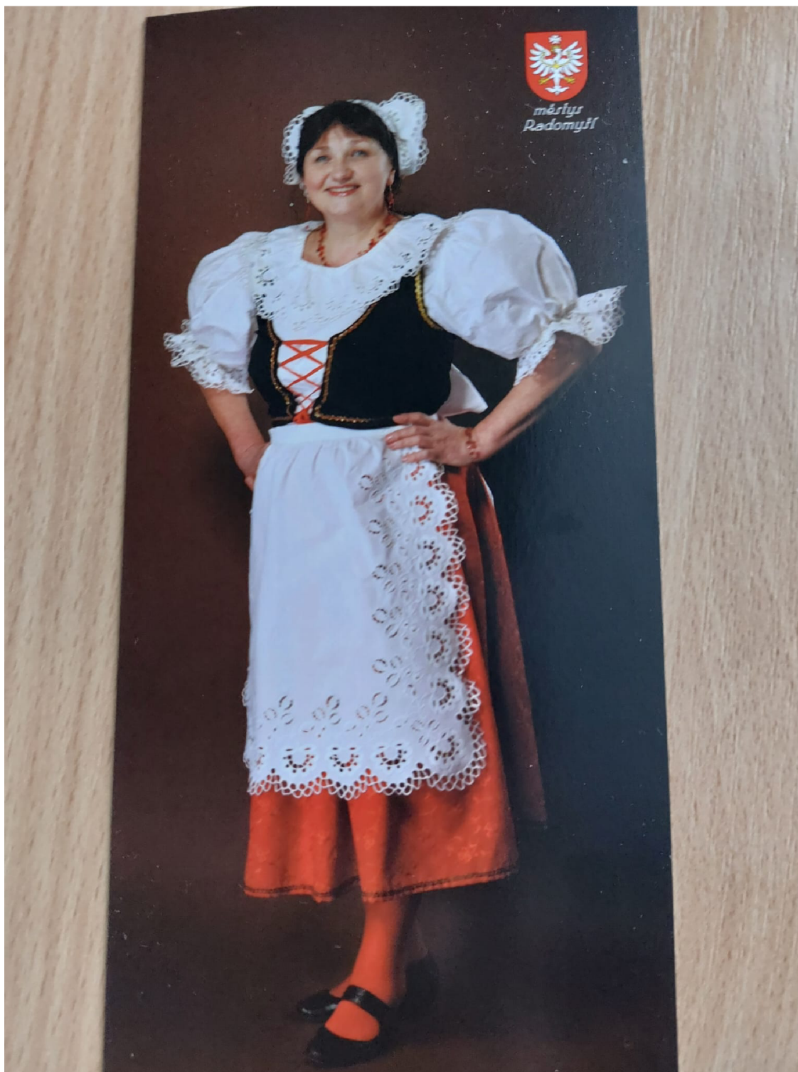
Obr. 2: České lidové kroje – ženský spolkový kroj tzv. „Mařenka“.