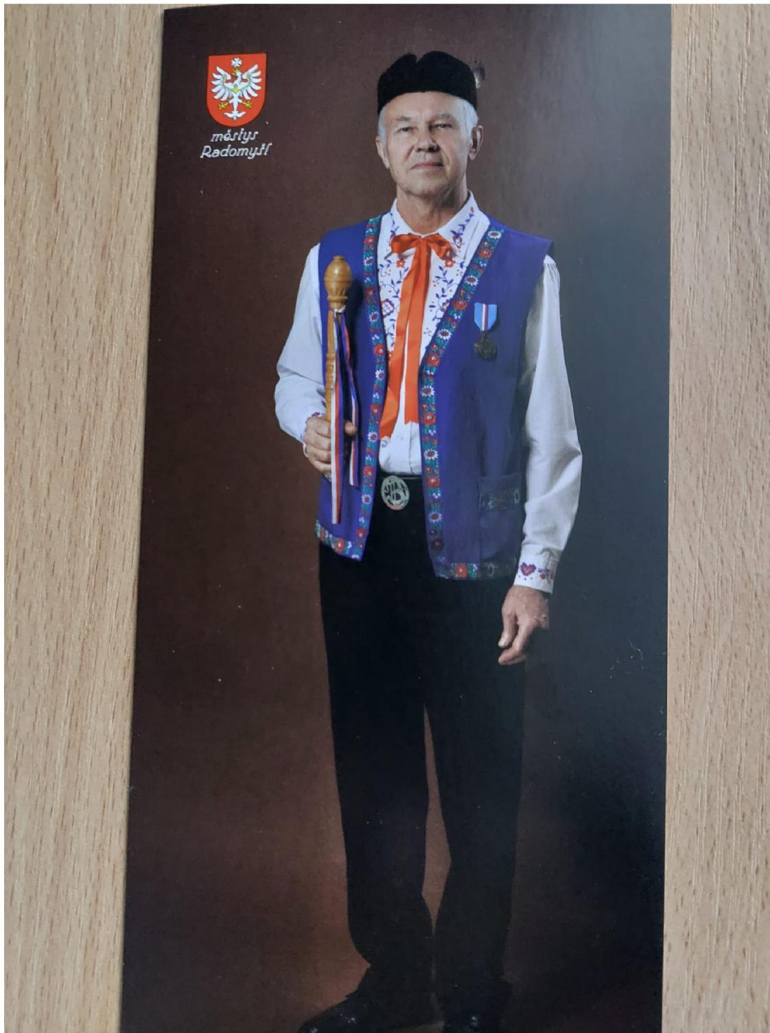
Obr. 1: České lidové kroje – mužský spolkový kroj „svěráz“.