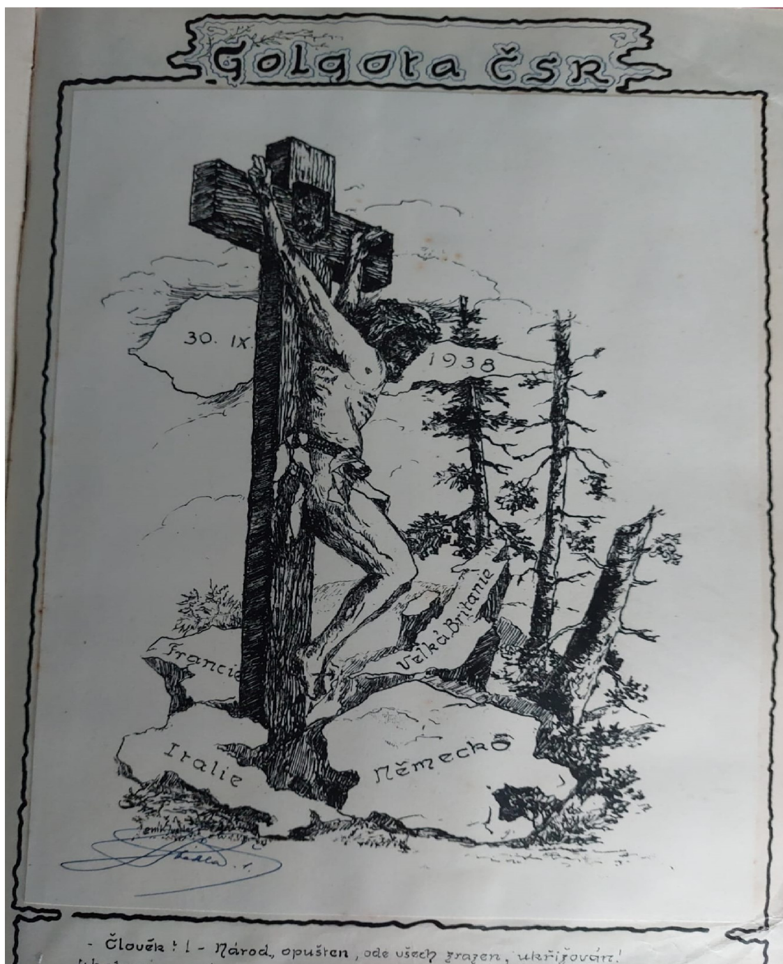
Obr. 5: Pamětní kniha Vlastenecko dobročinné sdružené obce baráčníků „Vitoraz“ v Týně nad Vltavou – perokresba, autor Jeník Švehla, 1938, „Golgota ČSR“.