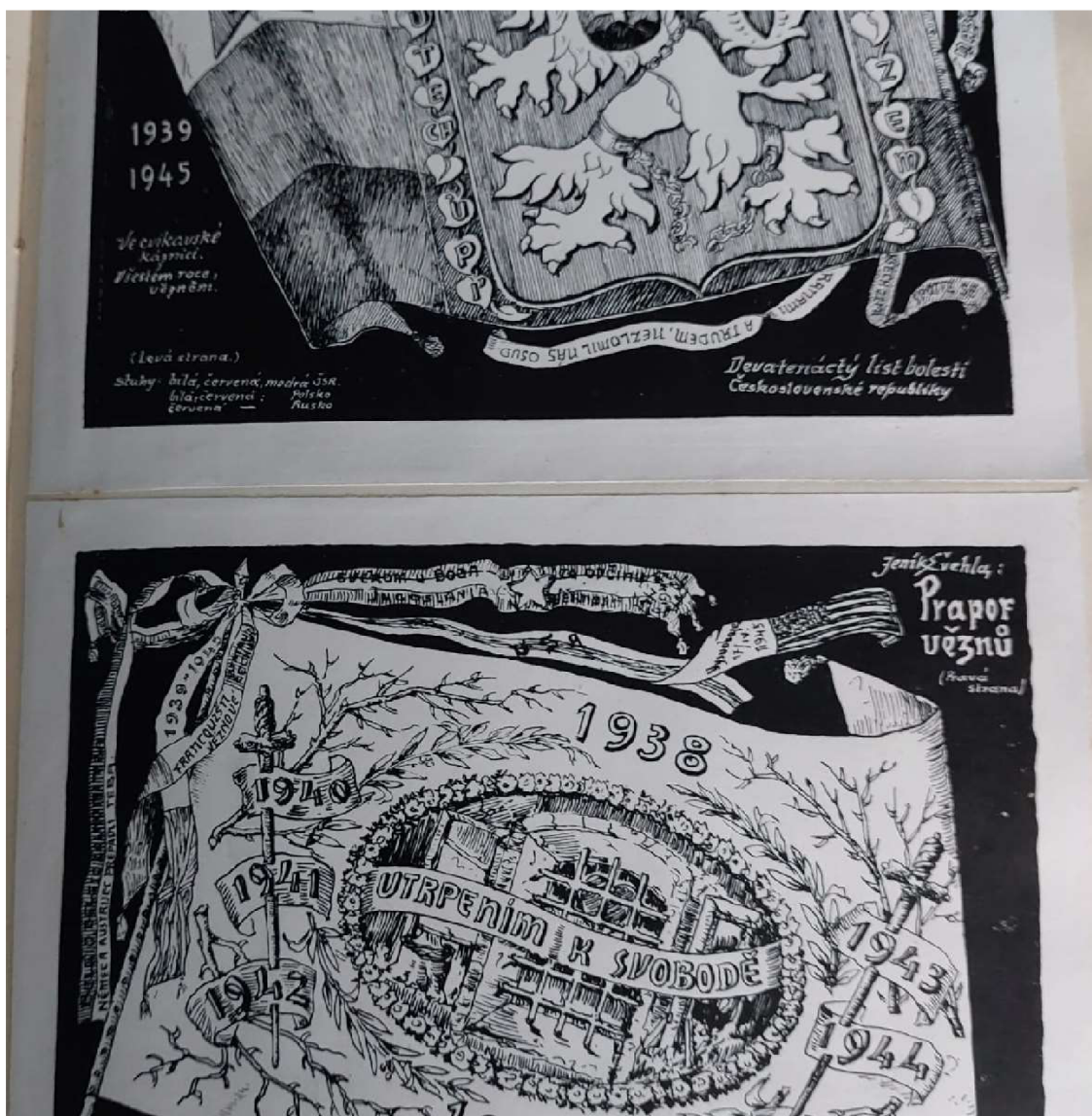
Obr. 6: Pamětní kniha Vlastenecko dobročinné sdružené obce baráčníků „Vitoraz“ v Týně nad Vltavou – perokresba, autor Jeník Švehla, 1939 – 1945 Praporek vězňů.