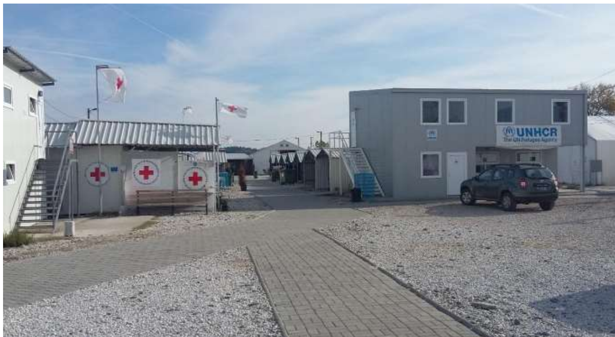
Obrázek 4 Záchytné středisko migrantů v Gevgeliji

se špatným zdravotním stavem, starších osob a dětí, včetně dětí bez doprovodu a odloučených dětí, atd.).