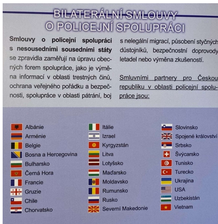
Obrázek 3 Bilaterální smlouvy o policejní spolupráci