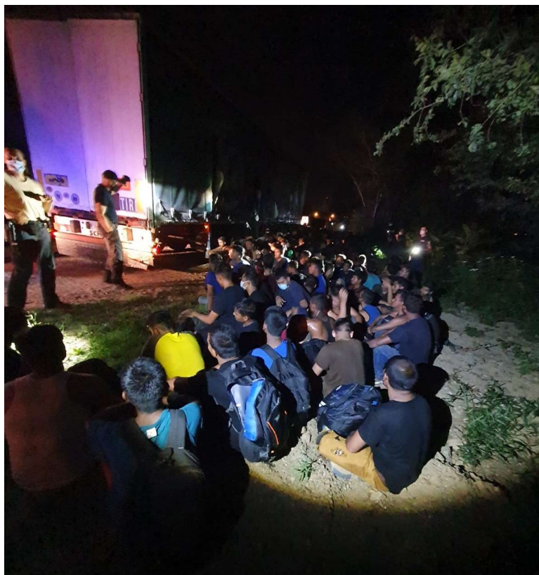
Obrázek 5 Zadržení nelegálních migrantů

termovizí, která své kolegy naváděla k místu, kde migranti do kamionu nastupovali. 76