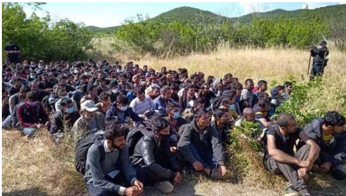
Obrázek 6 Zadržení nelegálních migrantů

motelu a tito neváhali a ve svém osobním volnu začali migranty pronásledovat. Společně se jim nakonec celou velkou skupinu podařilo zadržet. 77