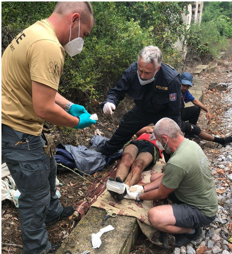
Obrázek 7 Záchrana života

profesionálního zásahu policistů by se naděje na přežití minimálně u jednoho z mužů výrazně snížila. Tento zásah jen posílil vynikající jméno, které v Severní Makedonii čeští policisté mají. 78