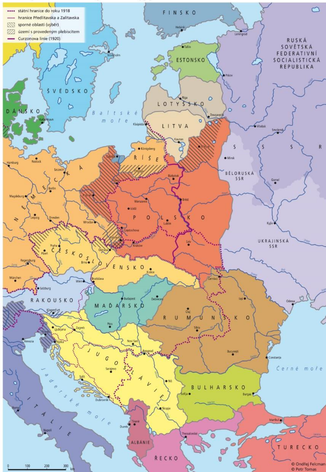
Státně politické uspořádání východní Evropy podle versailleské mírové konference, In: Felcman Ondřej, Územní vývoj střední Evropy v letech 1918–1993.