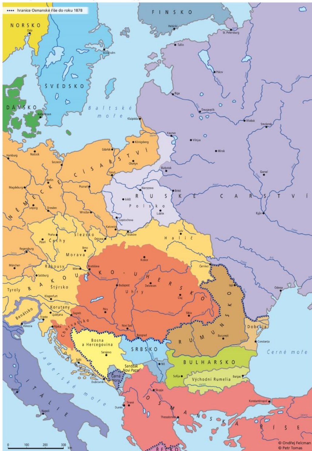
Státně politická organizace východní Evropy do roku 1918, In: Felcman Ondřej, Územní vývoj střední Evropy v letech 1918–1993.