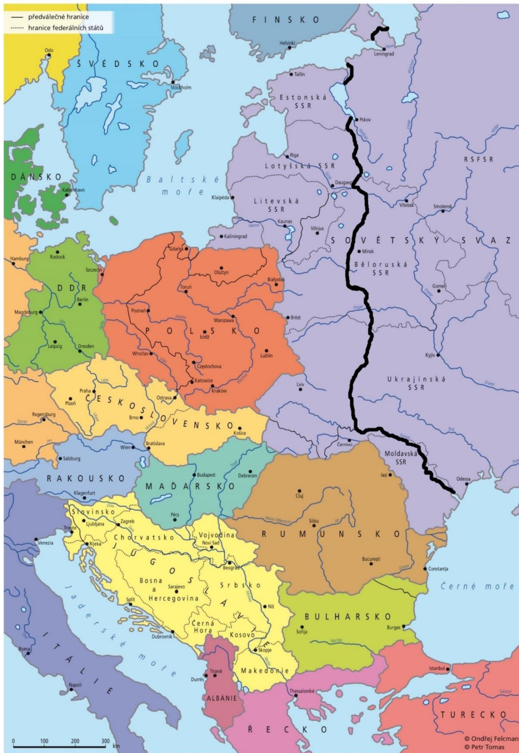
Státní uspořádání střední a východní Evropy po druhé světové válce, In: FELCMAN, Ondřej: Územní vývoj střední Evropy v letech 1918–1993. (Mapa upravena se souhlasem autora)