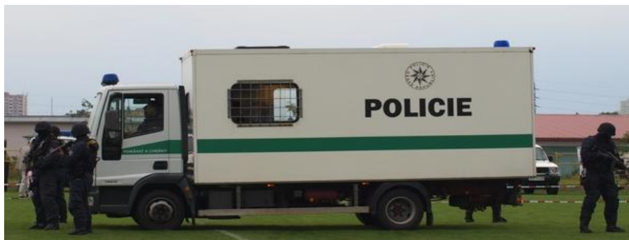
Obrázek č. 12: Eskortní vozidlo Policie ČR tovární značky Iveco Eurocargo