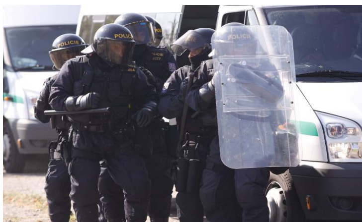
Obrázek č. 14: Nácvič základních činností družstva pořádkové jednotky