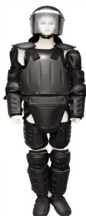
Obrázek č. 8: Protiúderový oblek a přilba