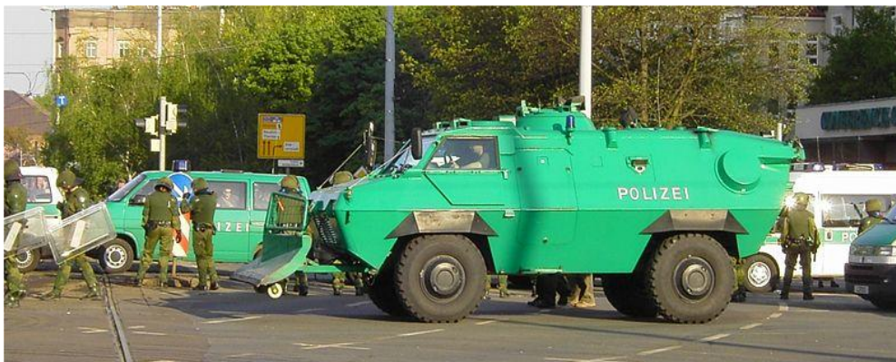
Obrázek č. 16: Obrněný vůz jednotky BPA působící v Lipsku