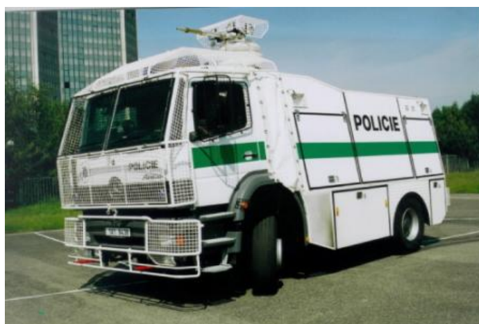
Obrázek č. 13: Vodní stříkač na podvozku vozidla zn. Mercedes Benz