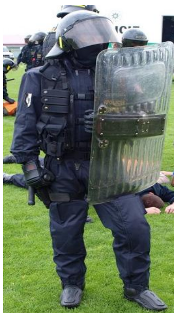
Obrázek č. 9: Příslušník SPJ PČR ve výstrojí určené k zákroku směřujícímu k obnovení veřejného pořádku