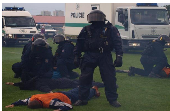
Obrázek č. 4: Ukázka zákroku SPJ PČR během akce „Den s Policií ČR „