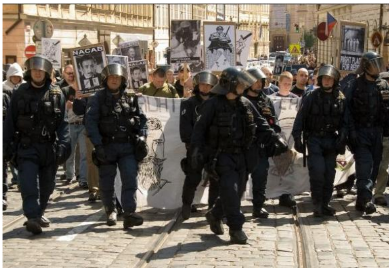
Obrázek č. 2: Policisté SPJ PČR doprovází protestní průvod v Praze