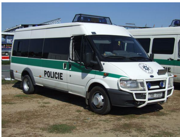
Obrázek č. 10: Služební vozidlo SPJ PČR tovární značky Ford Transit