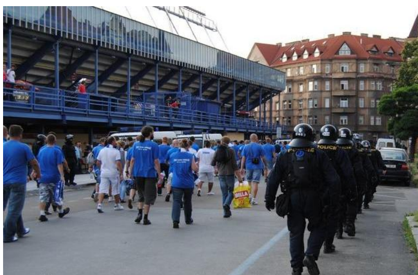
Obrázek č. 3: Policisté SPJ PČR zajišťují bezpečnost v okolí stadionu AC Sparta Praha v Praze na Letné během fotbalového utkání Ligy mistrů