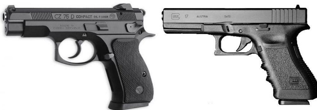
Obrázek č. 6: Pistole ČZ 75 D Compact (vlevo) a Glock 17 (vpravo)