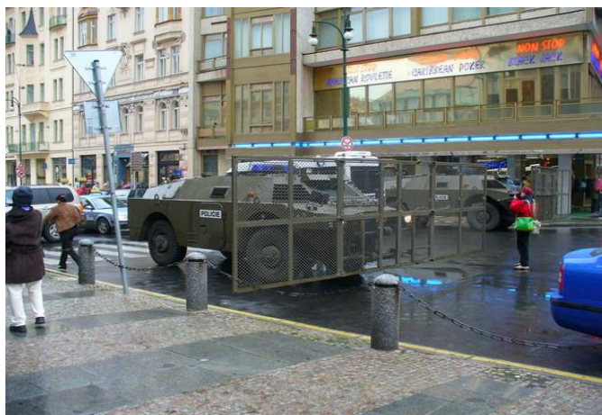
Obrázek č. 11: OKV-P s nasazenou konstrukcí s pletivem