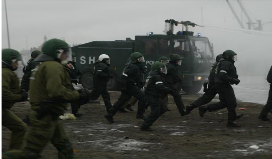
Obrázek č. 18: Vodní stříkač a příslušníci BPA při zákroku v Rostocku