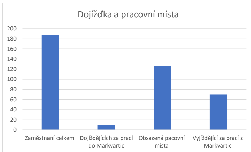
Graf 2: Dojíždka a pracovní místa