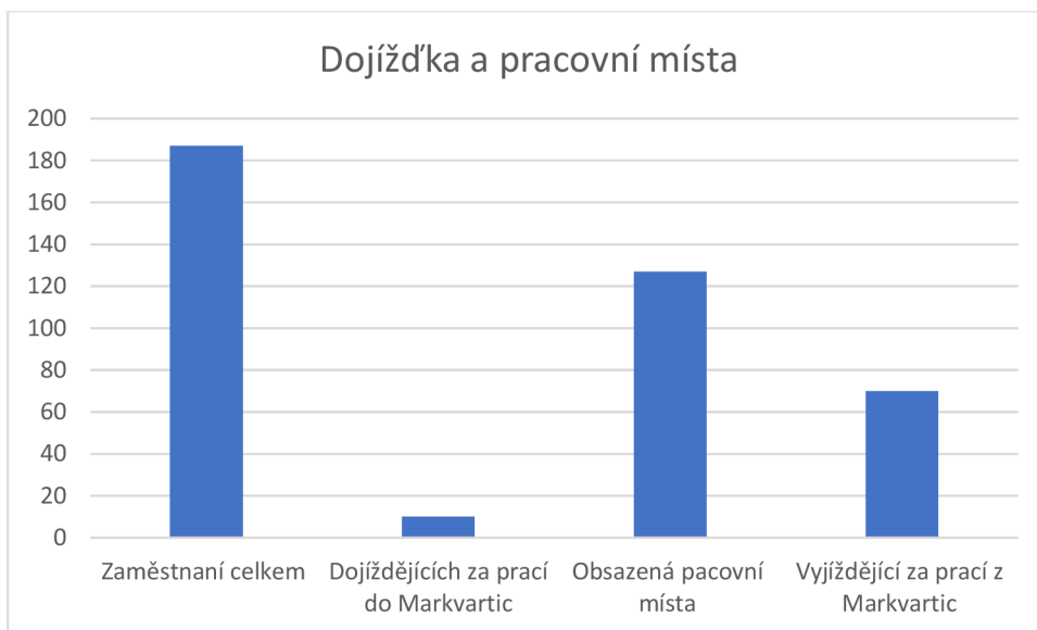
Graf 2: Dojíždka a pracovní místa