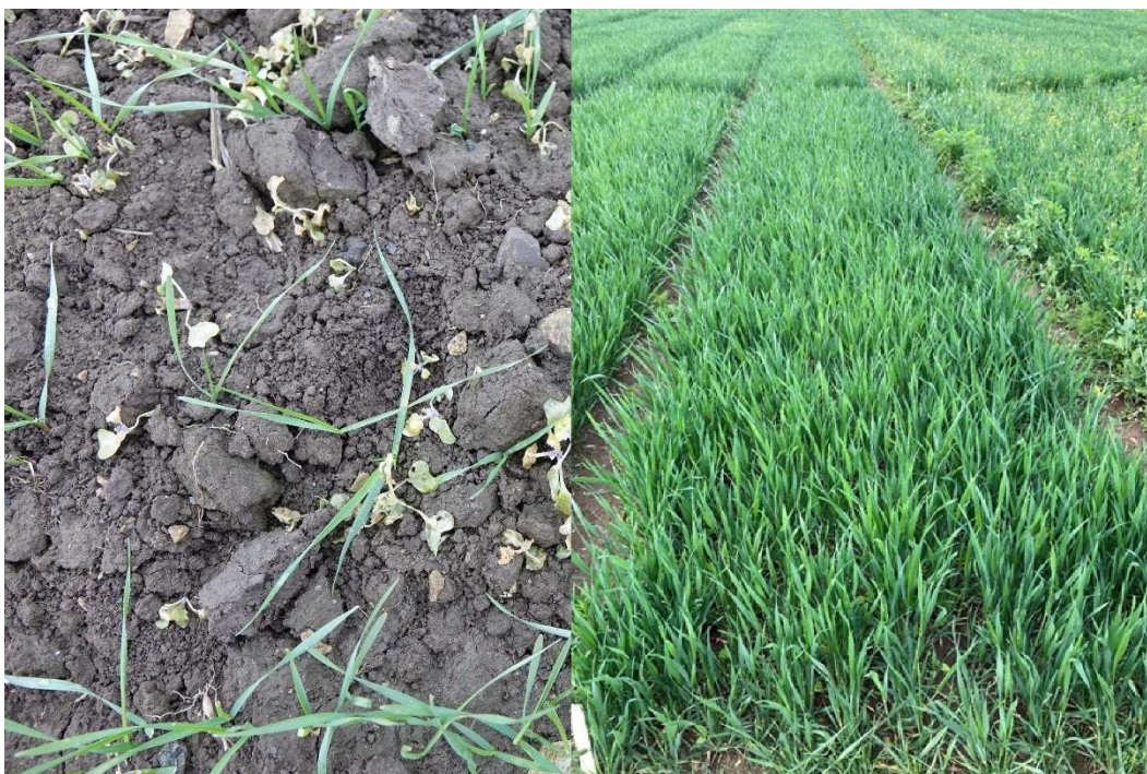
Obrázek č. 9: Pontos (0,5 l/ha) + Stomp Aqua (1,3 l/ha) krátce po aplikaci (vlevo) a 20. 5. 2021 (vpravo)