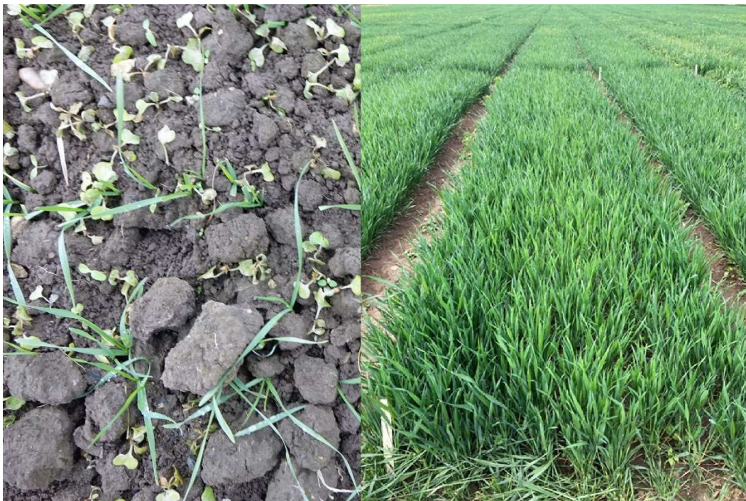
Obrázek č. 8: Pontos (0,4 l/ha) + Stomp Aqua (1 l/ha) krátce po aplikaci (vlevo) a 20. 5. 2021 (vpravo)