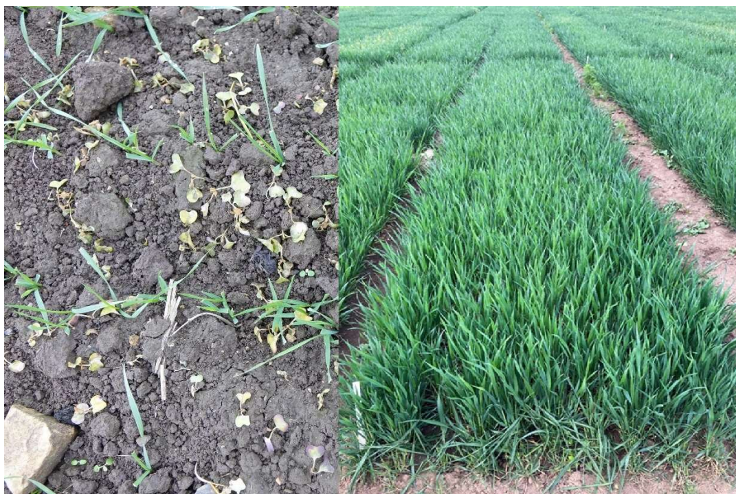
Obrázek č. 7: Chocker (0,5 l/ha) + Fragma (0,075 l/ha) krátce po aplikaci (vlevo) a 20. 5. 2021 (vpravo)