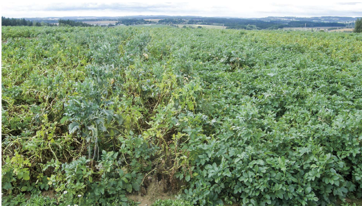
Obrázek č. 1: Výdrol řepky v porostu brambor (Kasal et al. 2014)