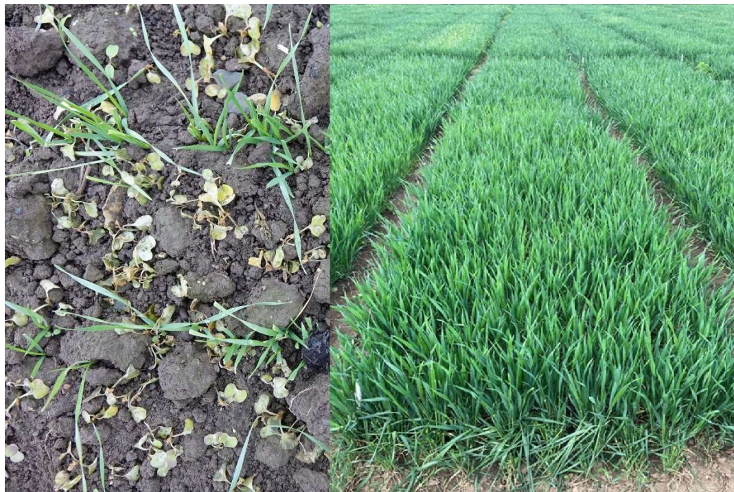
Obrázek č. 6: Pontos (0,4 l/ha) + Sekator OD (0,08 l/ha) krátce po aplikaci (vlevo) a 20. 5. 2021 (vpravo)