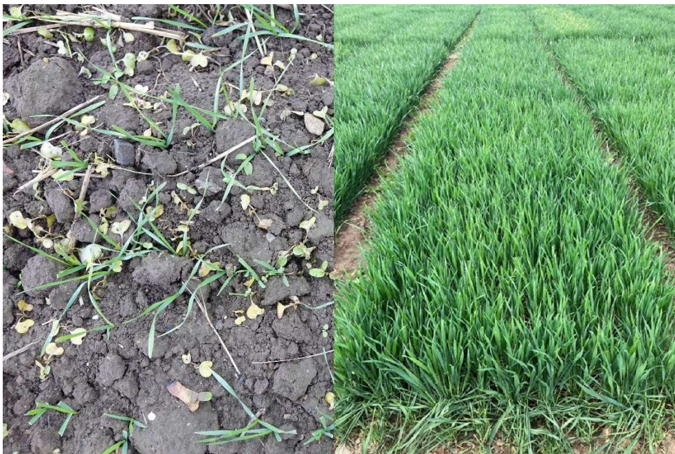
Obrázek č. 4: Pontos (0,5 l/ha) + Fragma (0,1 l/ha) krátce po aplikaci (vlevo) a 20. 5. 2021 (vpravo)