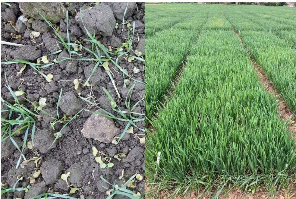
Obrázek č. 5: Pontos (0,5 l/ha) + Fragma (0,075 l/ha) krátce po aplikaci (vlevo) a 20. 5. 2021 (vpravo).