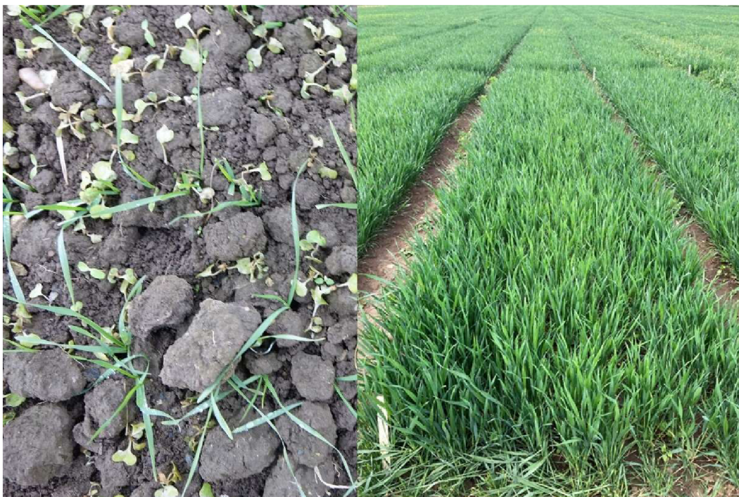
Obrázek č. 8: Pontos (0,4 l/ha) + Stomp Aqua (1 l/ha) krátce po aplikaci (vlevo) a 20. 5. 2021 (vpravo)