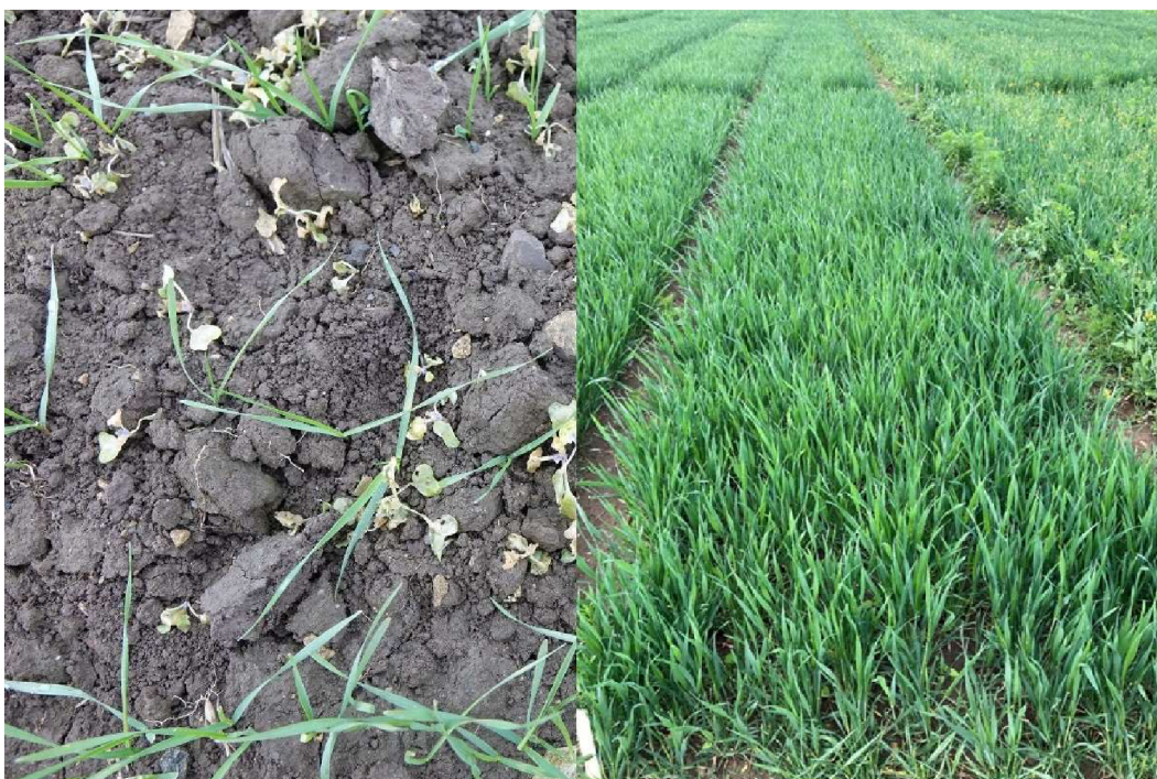
Obrázek č. 9: Pontos (0,5 l/ha) + Stomp Aqua (1,3 l/ha) krátce po aplikaci (vlevo) a 20. 5. 2021 (vpravo)