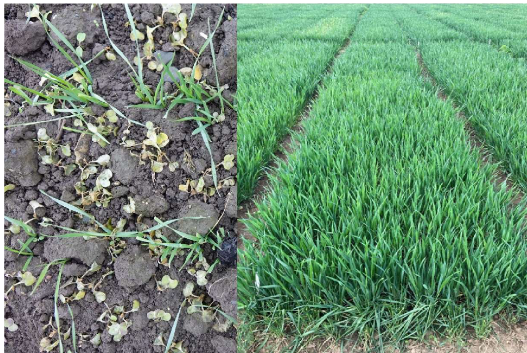
Obrázek č. 6: Pontos (0,4 l/ha) + Sekator OD (0,08 l/ha) krátce po aplikaci (vlevo) a 20. 5. 2021 (vpravo)