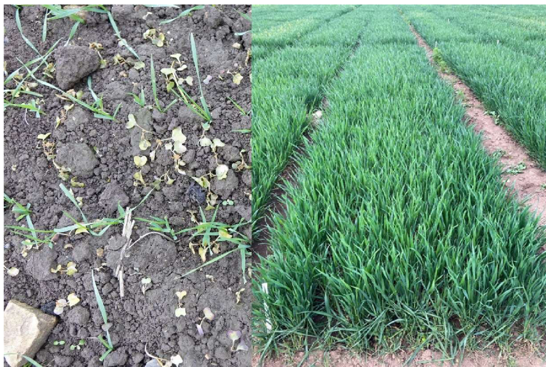
Obrázek č. 7: Chocker (0,5 l/ha) + Fragma (0,075 l/ha) krátce po aplikaci (vlevo) a 20. 5. 2021 (vpravo)