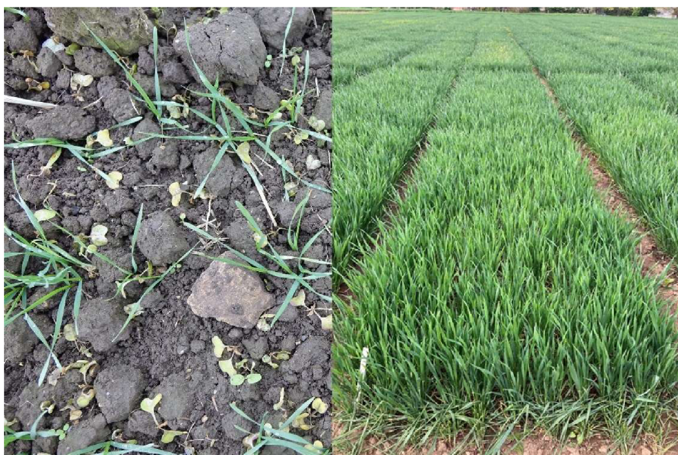
Obrázek č. 5: Pontos (0,5 l/ha) + Fragma (0,075 l/ha) krátce po aplikaci (vlevo) a 20. 5. 2021 (vpravo).