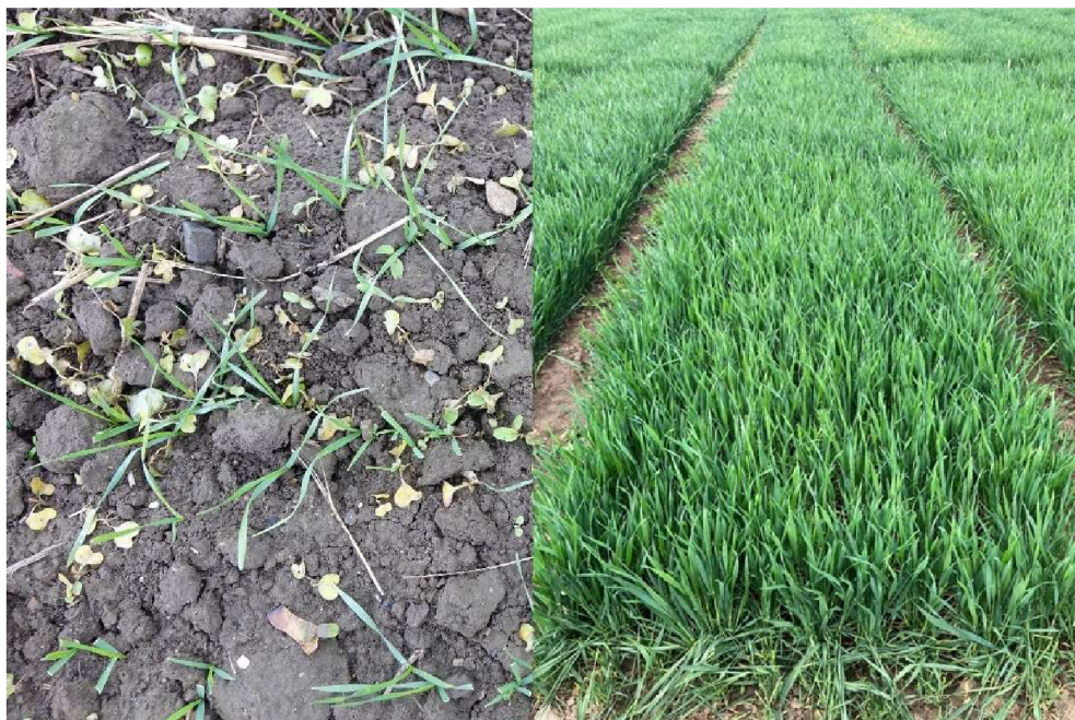
Obrázek č. 4: Pontos (0,5 l/ha) + Fragma (0,1 l/ha) krátce po aplikaci (vlevo) a 20. 5. 2021 (vpravo)