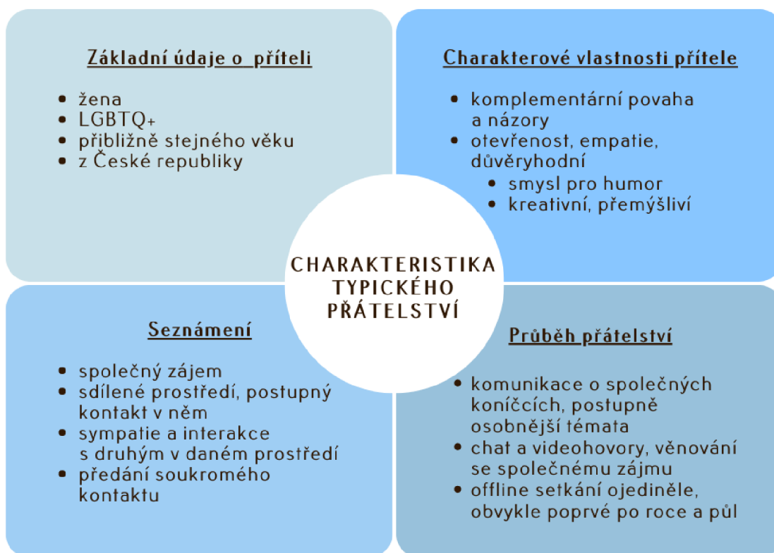
Schéma 1: Charakteristika typického přátelství