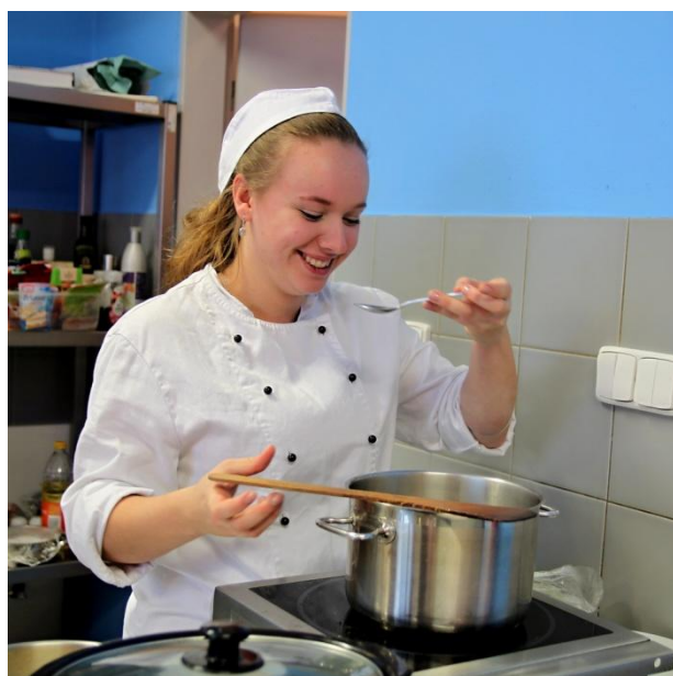
Obrázek, studentka při vaření vývaru. SOU Polička