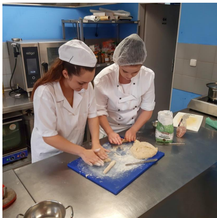
Obrázek, studentky při přípravě noků. SOU Polička