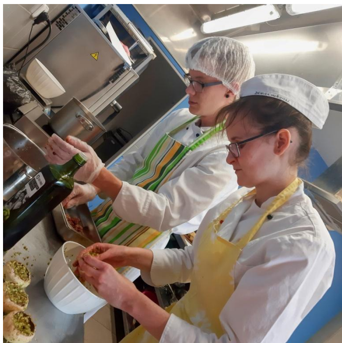
Obrázek, studenti připravují plněné žampiony. SOU Polička