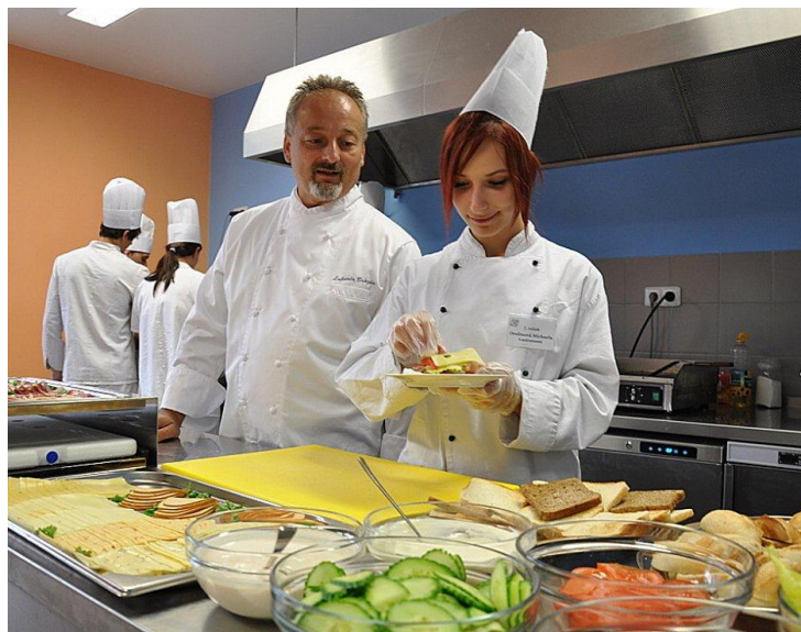
Obrázek: jak studenti připravují raut a obložené chlebičky a sendviče. SOU Polička

Příloha 2. Obrázky studentů při přípravě pokrmů ve cvičné kuchyni SOU a SOŠ Polička.