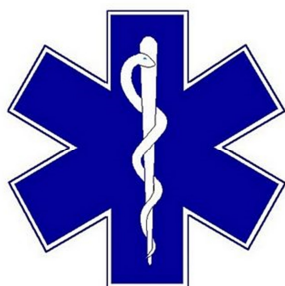
Obrázek 4 Znak Zdravotnické záchranné služby [29]

Zdravotnictví se v České republice změnilo po roce 1945. Státní zdravotnická správa začala postupně vytvářet rozsáhlou síť zdravotnických zařízení. V roce 1974 došlo k pokroku ve vytvoření zdravotnické záchranné služby. Vše změnila vyhláška č. 434/1992 Sb., ministerstva zdravotnictví České republiky o zdravotnické záchranné službě. Poslední zlom nastal 1. 1. 2003, kdy vzniklo 14 krajských středisek záchranné služby. [15]