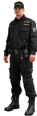
Obrázek 7 Uniforma Policie [30]