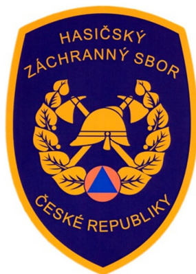
Obrázek 2 Znak Hasičského záchranného sboru ČR [29]