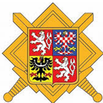
Obrázek 8 Znak Armády České republiky [33]

Armáda ČR poskytuje svoji pomoc tím, že nasazuje záchranné roty, ženijní prapory, specialisty s příslušnou technikou a živé síly. [4]