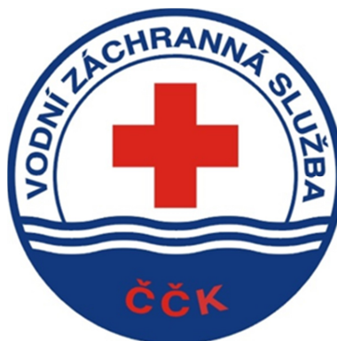
Obrázek 11 Znak Vodní záchranné služby [21]