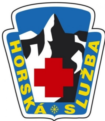
Obrázek 12 Znak Horské služby [18]