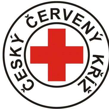
Obrázek 10 Znak Českého červeného kříže [20]