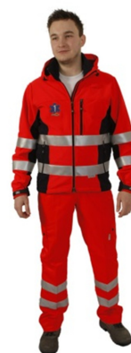
Obrázek 5 Uniforma ZZS [31]