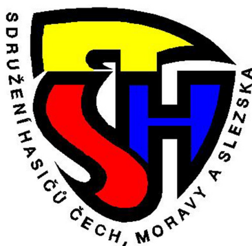
Obrázek 9 Znak Sdružení hasičů Čech, Moravy a Slezska [34]