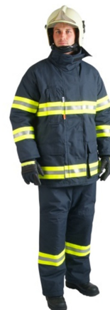
Obrázek 3 Uniforma HZS [32]