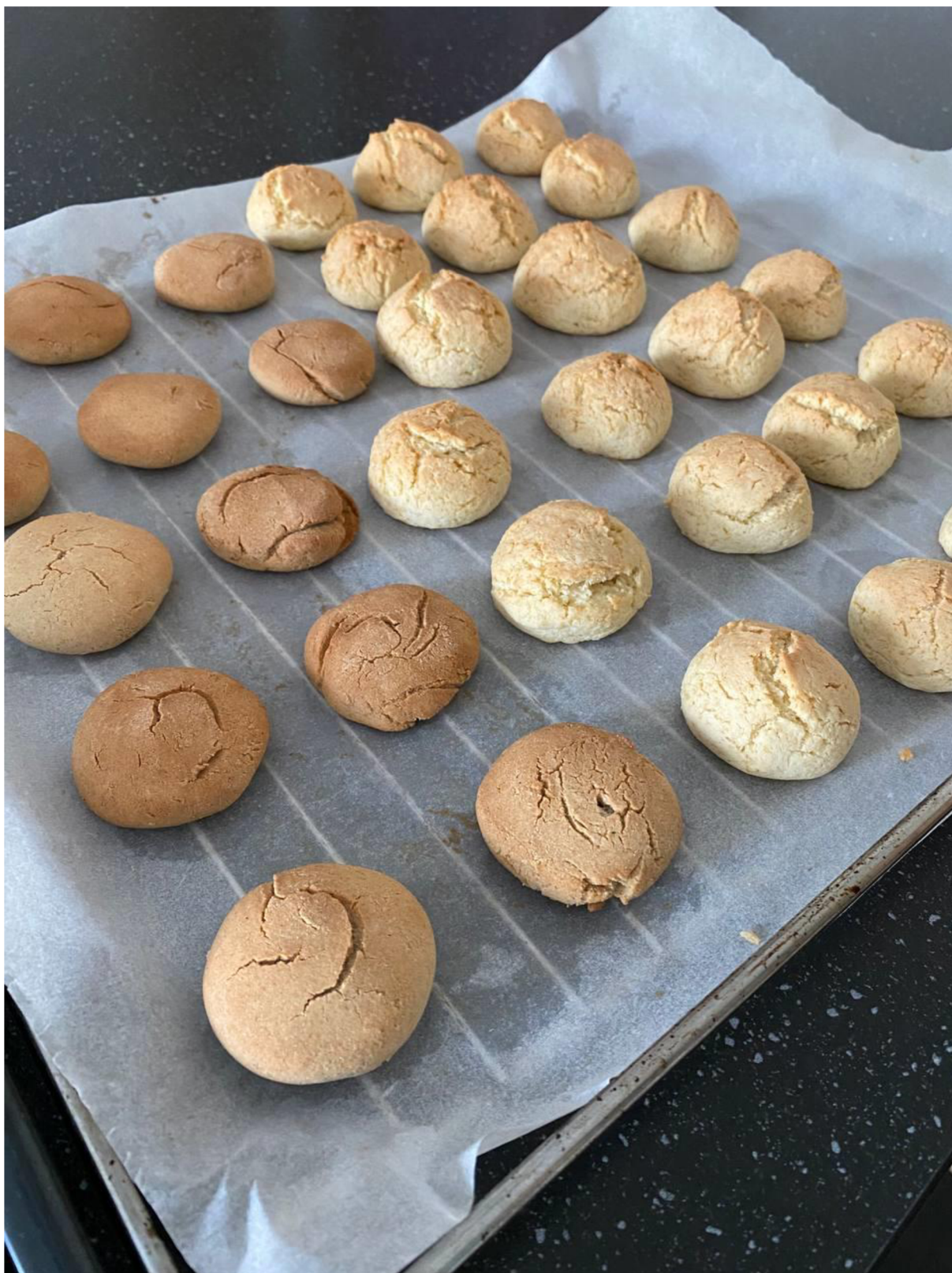
Příloha 2: Foto upečených sušenek