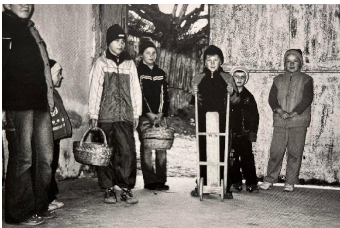
Obrázek 3: Koledování a řehtání rumunských dětí