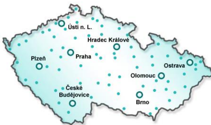
Obrázek 1 – Mapa středisek Probační a mediační služby České republiky (PMS, Probační a mediační služba ČR, online)

V České republice je zřízeno sedmdesát sedm středisek Probační a mediační služby, jejich umístění znázorňuje obrázek 1. Průměrně se v kraji nachází šest středisek, nejvíce jich je ve Středočeském kraji (třináct), nejméně v Karlovarském (tři). V kraji Královehradeckém je celkem pět středisek, a to ve městech Hradec Králové, Jičín, Náchod, Rychnov nad Kněžnou a Trutnov. (Kontakty, PMSČR, online) Výzkumné šetření, které je součástí empirické části práce, bylo provedeno na středisku v Hradci Králové.