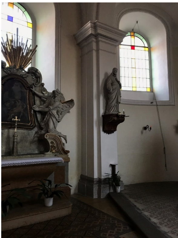
Obr. 7 Socha nejsvětějšího srdce Ježíšova