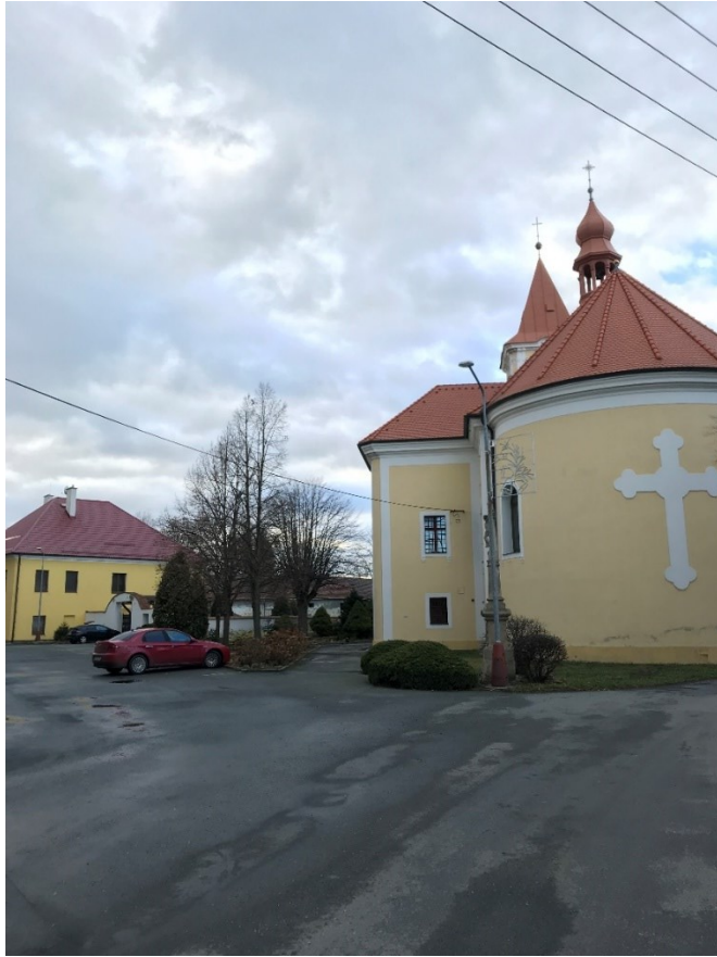
Obr. 1 Pohled na kostel a faru