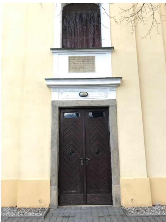
Obr. 3 Vchod do kostela a pamětní deska nad vstupními dveřmi