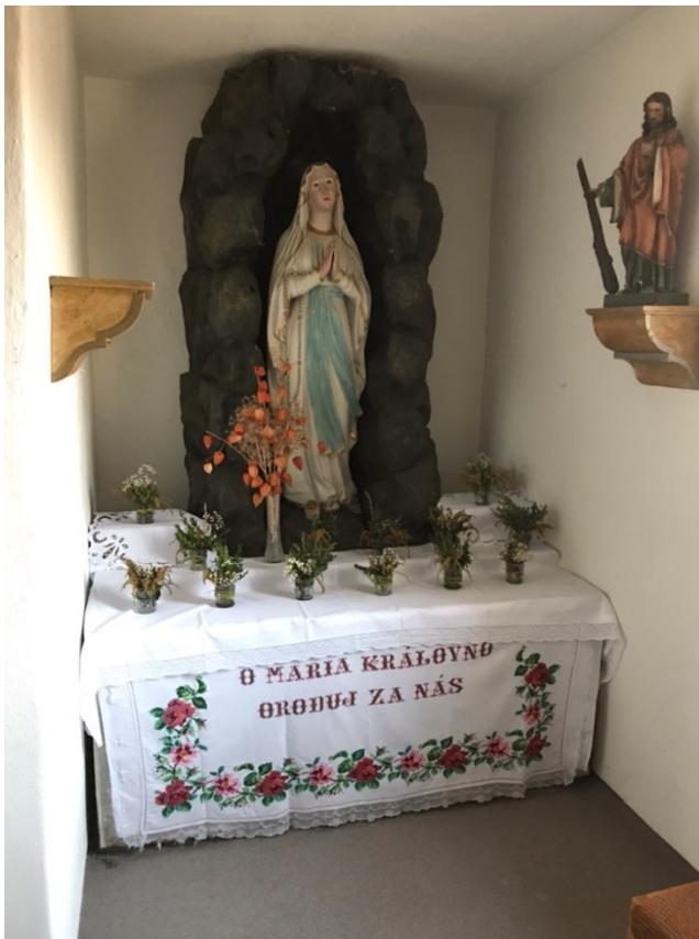
Obr. 12 Kaple lurdské Panny Marie