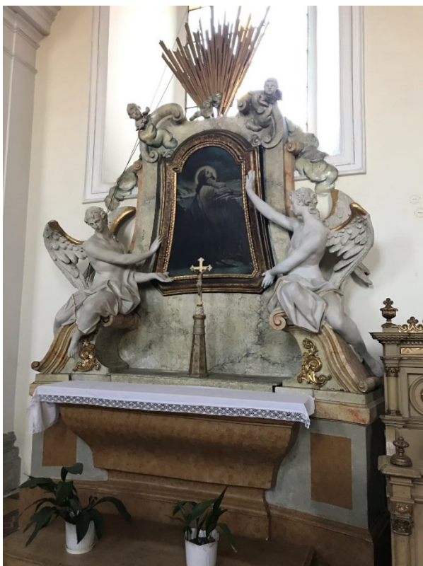
Obr. 10 Boční oltář sv. Ondřeje Avellinského