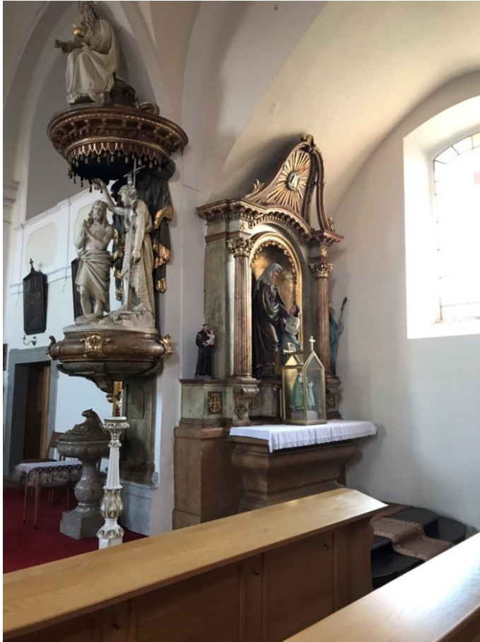
Obr. 13 Boční oltář sv. Anny, křtitelnice a 3 sochy – Jana Křtitele, Ježíše Krista a Boha Otce