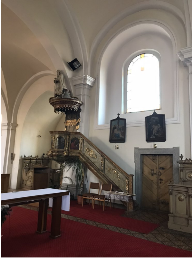
Obr. 14 Kazatelna