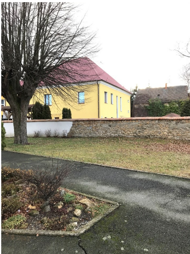
Obr. 4 Pohled na budovu fary od vchodu do kostela