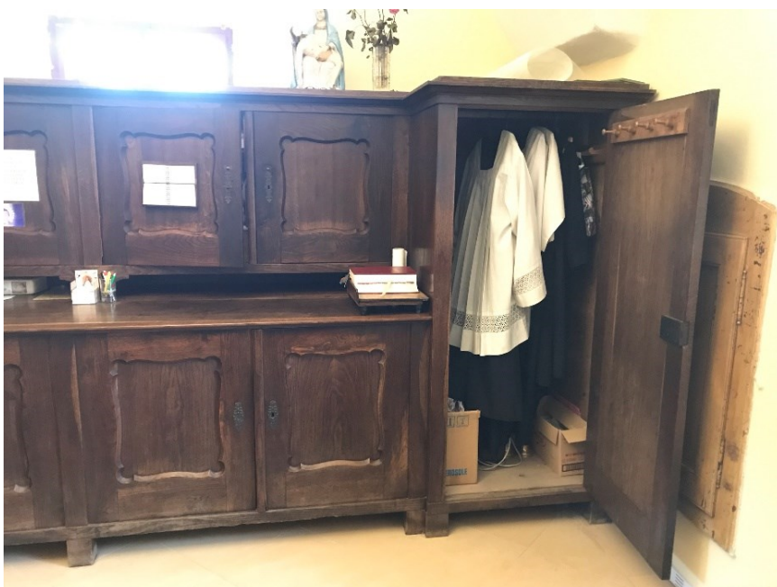
Obr. 5 Vyřezávaná skříň z 19. století v sakristii kostela