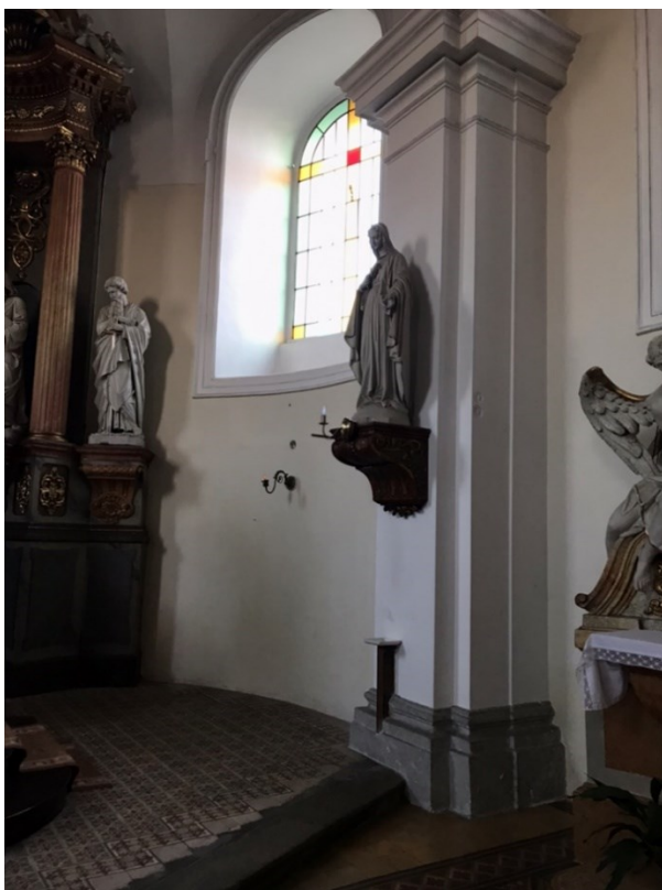
Obr. 8 Socha neposkvrněného srdce Panny Marie