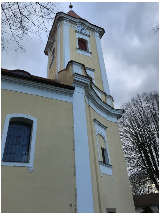
Obr. 2 Kostel Nanebevzetí Panny Marie v Horní Moštěnici