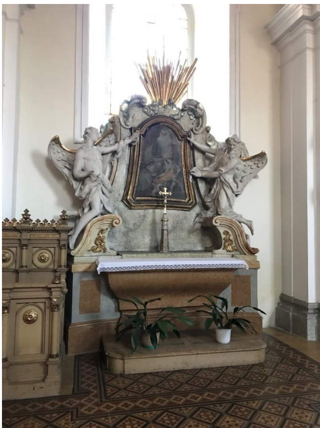
Obr. 9 Boční oltář sv. Františka Xaverského