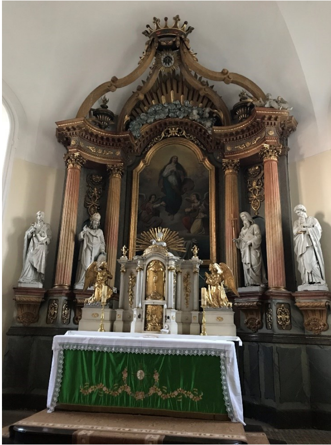
Obr. 6 Hlavní oltář s obrazem Nanebevzetí Panny Marie