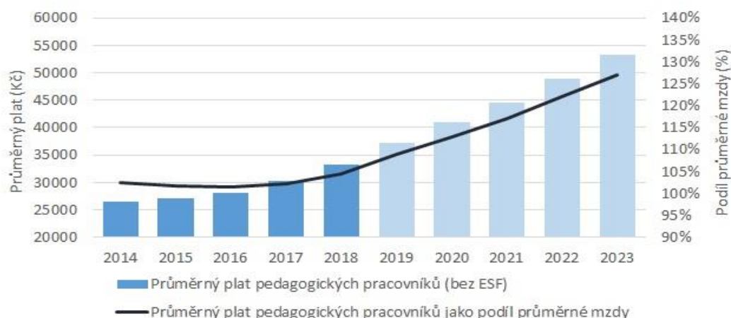
Graf 1: Vývoj průměrného platu pedagogických pracovníků ve vazbě na průměrnou mzdu v ČR

Odhad růstu průměrné mzdy v ekonomice v letech 2020 až 2023 je založen na střednědobém výhledu MF ČR.