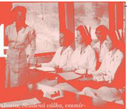
Dotyk dotykujeme 2