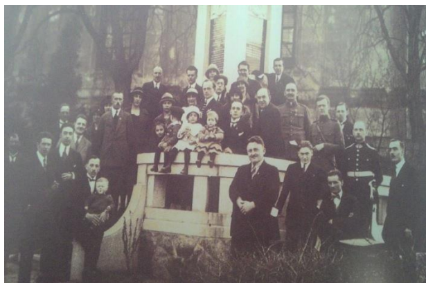
Obrázek 4. Sdružení české menšiny v Dubé

V letech 1914 začalo utrpení pro místní obyvatele. Byli vyslýcháni a zavíráni, nesměli mluvit česky. Vypovídalo se z bytů, z práce, lidé žili pod neustálým tlakem a výhrůzkami. Do zdejší německé školy přesto chodilo v letech 1890–1914 v průměru 47 žáků, jejichž rodiče byli české národnosti. Od roku 1914 po vypuknutí 1. světové války, kdy byl český občan vystaven zvýšenému teroru, poklesl počet dětí na 10. 35 Češi neměli žádné zastání, v Dubé nebyla česká škola, nebyl zde jediný český spolek (obr. 3) 36 , kdokoliv, kdo by šířil vlasteneckého ducha a bránil před poněmčením.