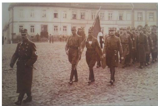
Obrázek 5. Jednotka SA

opětovně na Dubsko nacionalistické protičeské tendence a převaha německého obyvatelstva se nechala strhnout k fanatismu. (obr. 4 a 5) 37