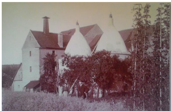
Obrázek 3. Sušárna chmele

V Dubé začal během 18. a 19. století vzkvétat blahobyť. Bylo to také ovlivněno tím, že ležela stranou od hlavních zemských silnic a slezské války se jí dotkly mnohem méně, než jiných měst v českolipské oblasti. Dubské obyvatelstvo se začalo úspěšně zabývat chmelařstvím a dobytčářstvím.