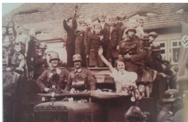
Obrázek 6. Uvítání německé posádky 1938

V roce 1938 nastaly dny těžkého pokoření, a v celém pohraničí byl nařízený ústup. Dubá byla mnichovským diktátem spolu s ostatním pohraničím připojena k německé říši a její hospodářství tím bylo ochromeno. V této době byli téměř všichni Češi nuceni opustit Dubou a české školy byly zavřeny.