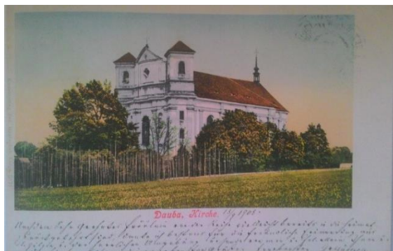
Obrázek 2. Kostel Nalezení Svatého kříže

vstoupilo období vrcholného baroka. Nejvýznamnější stavbou, která vznikla za jeho působení a na jeho náklady je rozhodně kostel Nalezení svatého kříže a sousoší Nejsvětější Trojice na náměstí.