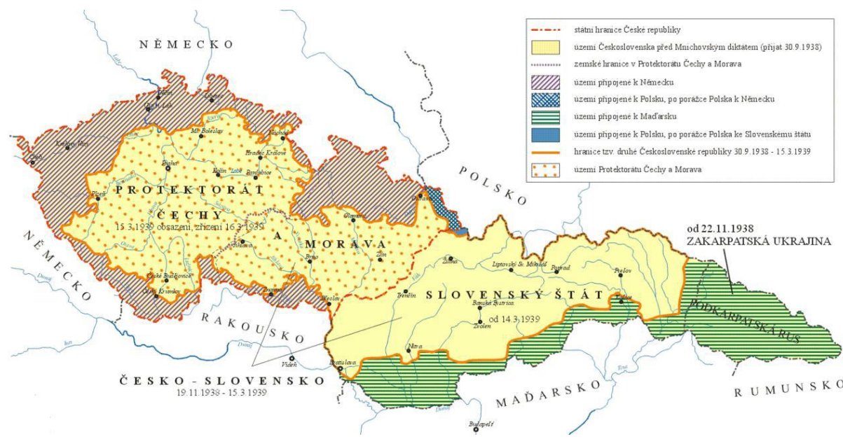
Obrázek 1. Mapa protektorátu Čech a Moravy

Níže uvedená mapa 12 ukazuje teritorium bývalého Československa po roce 1939 (Protektorát Čechy a Morava, Slovenský štát, území připojené k Německu, k Polsku a k Maďarsku).