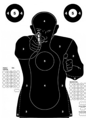
Obrázek 3: Terč pro Evropský policejní parkur 36

Tato střelecká disciplína, zkráceně nazývána EPP, se střílí v zemích západní Evropy. Jde o střelbu z velkorážných pistolí (pistole ráže 9mm, délka hlavně maximálně 4 palce) nebo revolveru (revolvery ráže .38 Special nebo .357 Magnum, spoušťový mechanismus double action, maximální délka hlavně 4 palce) na speciální terč. Střelec střílí jednoruč i obouruč v různých polohách v celkovém maximálním čase 5 minut a 30 vteřin, kdy maximální výsledek je 250 bodů. 35