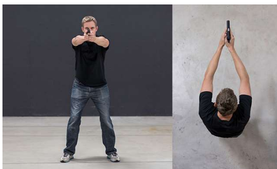
Obrázek 5: Čelní postoj – „Áčko“ 60