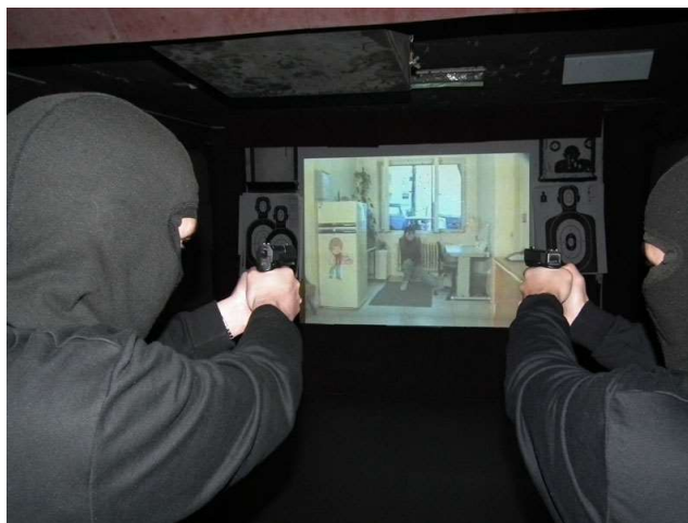
Obrázek 8: Projekční videostřelnice 69

Náročnost popisovaného suchého nácviu spočívá zejména v jeho neatraktivnosti a nudnosti. Brzká ztráta motivace z takto stereotypního tréninku je jeho největší překážkou. Východiskem proto může být užití prostředků, které nahrazují neatraktivní suchý trénink, šetří velké množství neúčelně vystřelené munice, ale zároveň zajišťují potřebnou indikaci zásahů cíle. Z těchto důvodů je vhodné užít střelecké trenažéry. Těch existuje celá řada v různých cenových relacích, jež odrážejí jejich užité vlastnosti. V nejdražším případě se může jednat o projekční videostřelnice, lze ale využít i například dostupnější trenažéry na bázi laserových zářičů vložených do zbraně, kdy kompatibilní terče indikují „zásah“. Takový trénink lze pro zatraktivnění doplnit časovačem, neboli timerem, který udává startovní signál, a zároveň umožňuje porovnávat jednotlivá provedení z hlediska potřebného času. 68