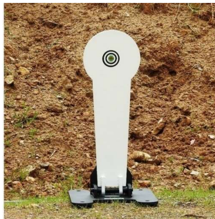
Obrázek 2: Kovový terč disciplíny IPSC 25

V rámci počítání výsledků střelce metodou Comstock, pojmenovanou po svém tvůrci Waltu Comstockovi, se zohledňuje doba potřebná k splnění disciplíny a zásahy, přičemž střelec má k dispozici neomezený čas i množství střeliva. Nezasažení terče předepsaným počtem zásahů je penalizováno. Doba střelby je měřena ručním měřicím zařízením, tzv. timerem, a to od startovního signálu po poslední výstřel 26 .