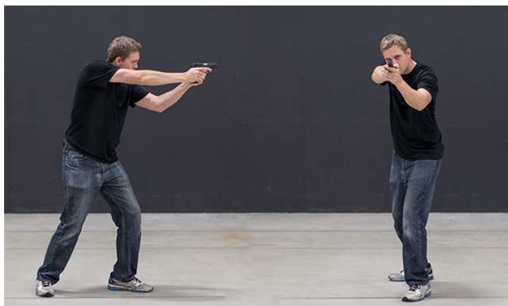
Obrázek 4: Postoj Weaver 57

- Naproti tomu je v rozporu filozofií moderních ochranných balistických prvků policistů, které chrání zejména přední a zadní stranu těla, vytočena nechráněná boční strana těla policisty směrem k možnému zdroji střelby – k cíli. Z tohoto důvodu nemusí být tato střelecká pozice vhodná pro využití v policejní praxi. 56