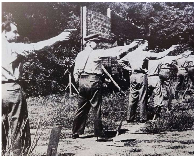
Obrázek 7: Střelecký postoj příslušníků VB při výcviku 62

Přesto lze z výše uvedeného vyvozovat určitou výhodnost kombinovaného postoje, který je v současné době využíván jak střelci praktických sportovních disciplín, tak policisty.