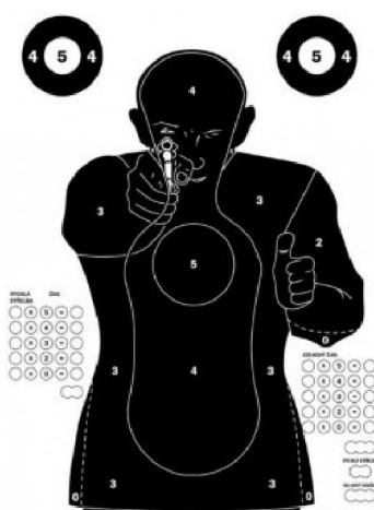
Obrázek 3: Terč pro Evropský policejní parkur 36

Tato střelecká disciplína, zkráceně nazývána EPP, se střílí v zemích západní Evropy. Jde o střelbu z velkorážných pistolí (pistole ráže 9mm, délka hlavně maximálně 4 palce) nebo revolveru (revolvery ráže .38 Special nebo .357 Magnum, spoušťový mechanismus double action, maximální délka hlavně 4 palce) na speciální terč. Střelec střílí jednoruč i obouruč v různých polohách v celkovém maximálním čase 5 minut a 30 vteřin, kdy maximální výsledek je 250 bodů. 35