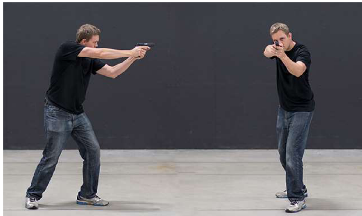
Obrázek 4: Postoj Weaver 57

- Naproti tomu je v rozporu filozofií moderních ochranných balistických prvků policistů, které chrání zejména přední a zadní stranu těla, vytočena nechráněná boční strana těla policisty směrem k možnému zdroji střelby – k cíli. Z tohoto důvodu nemusí být tato střelecká pozice vhodná pro využití v policejní praxi. 56