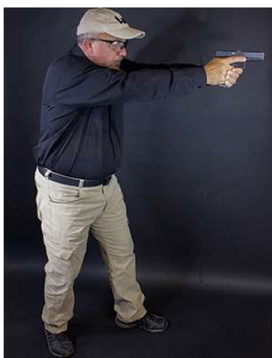
Obrázek 6: kombinovaný postoj – Weaver/Chapman 61