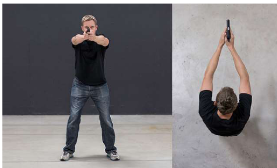
Obrázek 5: Čelní postoj – „Áčko“ 60