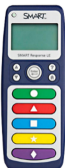
Obr. 2: SMART response – hlasovací zařízení

Notebook neboli přenosný počítač, který slouží stejným účelům jako stolní počítač a umožňuje flexibilní využití ve vzdělávacím procesu.