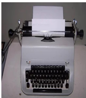
Obr. 6: Mechanický psací stroj Consul