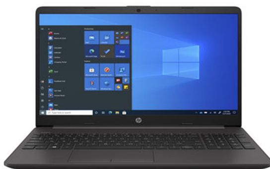
Obr. 1: Notebook HP 255 G8

Technologie využívané v dnešní době jsou například: