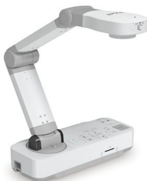
Obr. 3: SMART vizualizér pro záznam i projekci

Response zařízení je součástí radiového hlasovacího systému. S jeho pomocí může učitel snadno a rychle ověřit zajímavou formou znalosti žáků ve třídě, kdy se zapojí všichni současně.