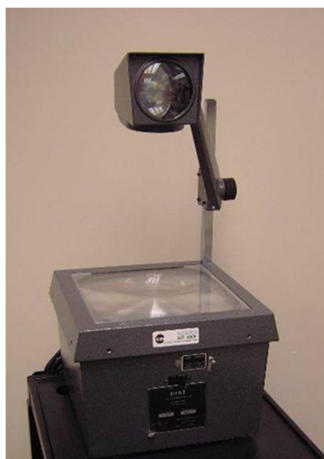
Obr. 5: Zpětný projektor Meotar

Počátky zařazování technologií do vyučování jsem osobně zaznamenávala v 80. letech. V ekonomicky a technologicky zaostalejší Československé socialistické republice se uskutečňovaly oproti západnímu světu spíše pozvolným přechodem. Od promítacích přístrojů přes meotary (viz obr. 5), psací stroje (viz obr. 6), kalkulačky (viz obr. 7) až k prvním počítačům (viz obr. 8).