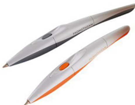
Obr. 4: SMART Activ pero

Vizualizér je webová 3D vizualizační zařízení založené na umělé inteligenci využívané pro záznam a projekci jakýchkoli dat a souborů.