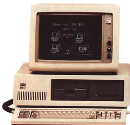
Obr. 8: IBM 286 Personal Computer XT (též IBM PC/XT) 17

V 90. letech se na školách začínají zřizovat počítačové učebny, které jsou zpočátku využívány v rámci počítačových kroužků nebo nepovinného předmětu informatika. Žáci se zde seznamovali se základy práce s výpočetní technikou, aplikacemi pro běžnou uživatelskou práci a také se základy algoritmizace a programování. Do kontaktu s počítači a informačními technologiemi postupně přicházeli prakticky všichni žáci. 16