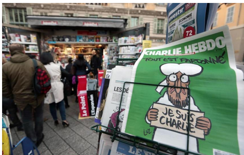
Obrázek 3 — Titulní strana kontroverzního francouzského časopisu Charlie Hebdo [3]

intenzivním a jasně viditelným. Všechny tyto skutky byly přímo plánovány s cílem maximalizovat brutální povahu násilí a s úmyslem vyvolat v ostatních hněv. Terče byly zvoleny tak, aby byly co nejznámější a zároveň působily bezpečně – letiště, noční klub nebo uzly hromadné dopravy. Útoky byly kromě toho načasovány s cílem zaručit přítomnost co možná největšího množství lidí na místě, proti němuž byl útok vedený. Podstatou těchto konstruovaných událostí je ochromit mysl diváků a doslova je hypnotizovat. 27 Každé vraždění a mrzačení je násilné, ale nepostihuje pouze ty, kterým je následně udělen trest smrti, nýbrž mají také druhotný dopad, neboť tím jak demonstrativně působí, vyvolávají pocity zhnusení a nenávisti v lidech, kteří se stávají jejich svědky. Útok na redakci Charlie Hebdo v Paříži ospravedlňuje jemenská odnož Al-Kaidy, která se k teroru přihlásila, jako důsledek znesvěcení jejich muslimských svátostí. 28