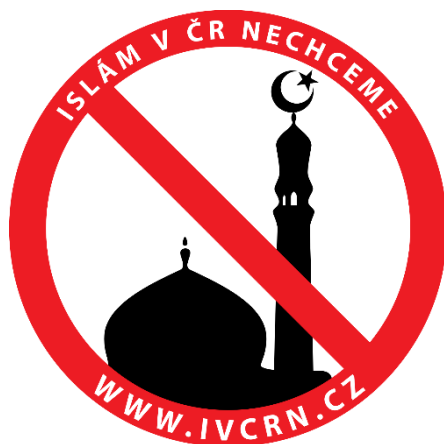
Obrázek 1 — Logo iniciativy Islám v ČR nechceme [1]

informace o islámu, které ovládají českou neinformovanou společnost. Tato organizace má stoupající počet sympatizantů a stala se i mezi lidmi na Facebooku velice populární. V prosinci 2010 měla facebooková skupina 55 000 příznivců, v roce 2014 vzrostl počet sympatizantů na dvojnásobek a v roce 2016 než byla stránka zrušena, se činila přes 164 000 příznivců a odpůrců islámu. 4