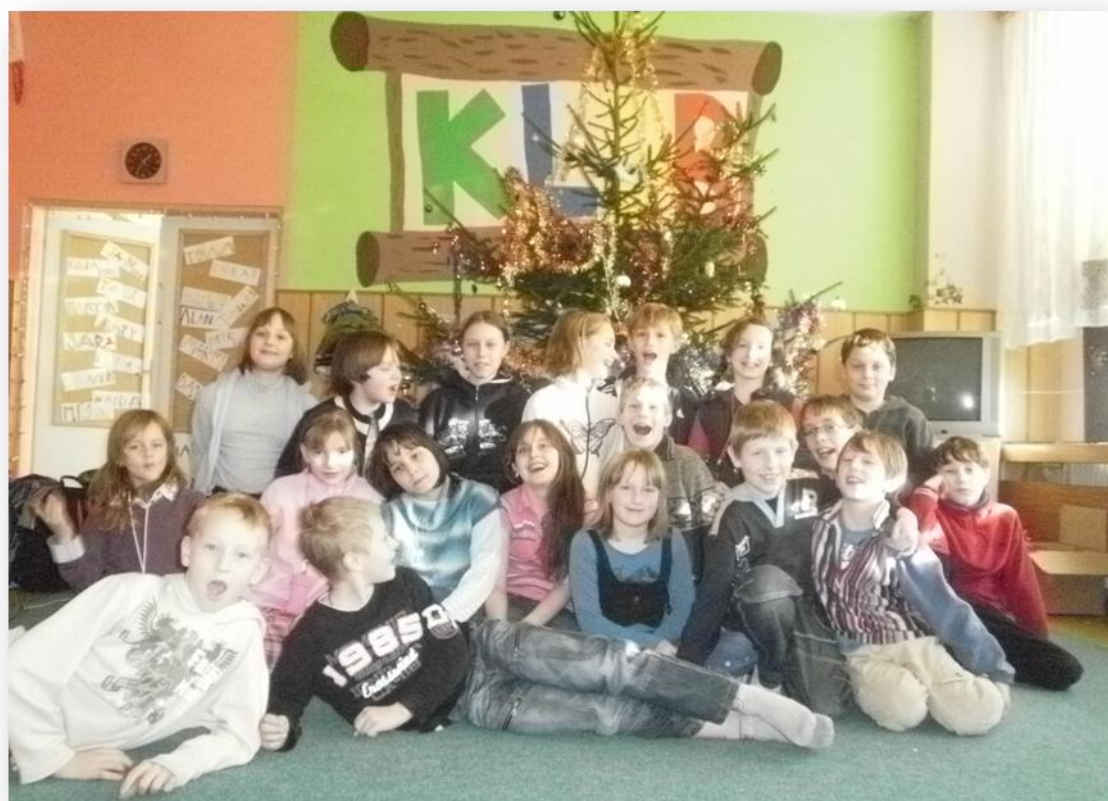
„Klubáci“ pod vánočním stromečkem.