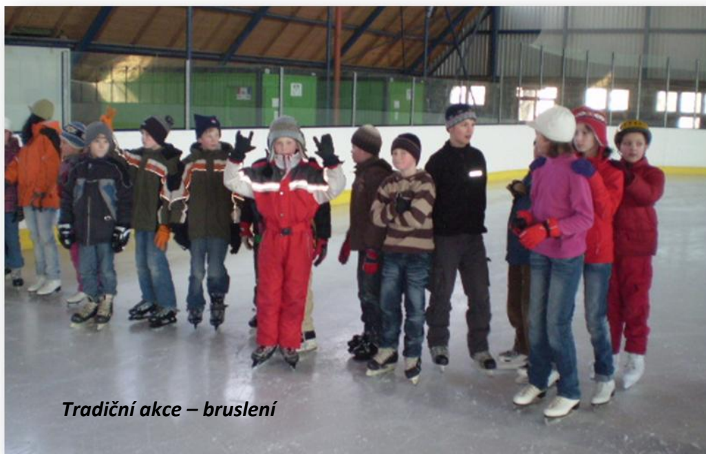
Tradiční akce – bruslení