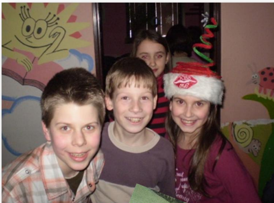
Jsme dobrá parta kluků a holek ...