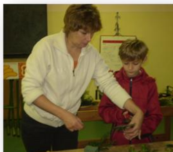
Dílňa s rodiči.