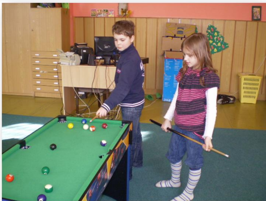
Herní stůl je nejvíce využívanou hrou