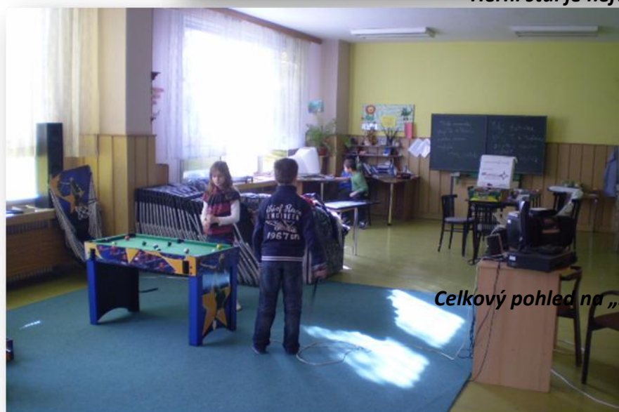
Celkový pohled na „školní klub“