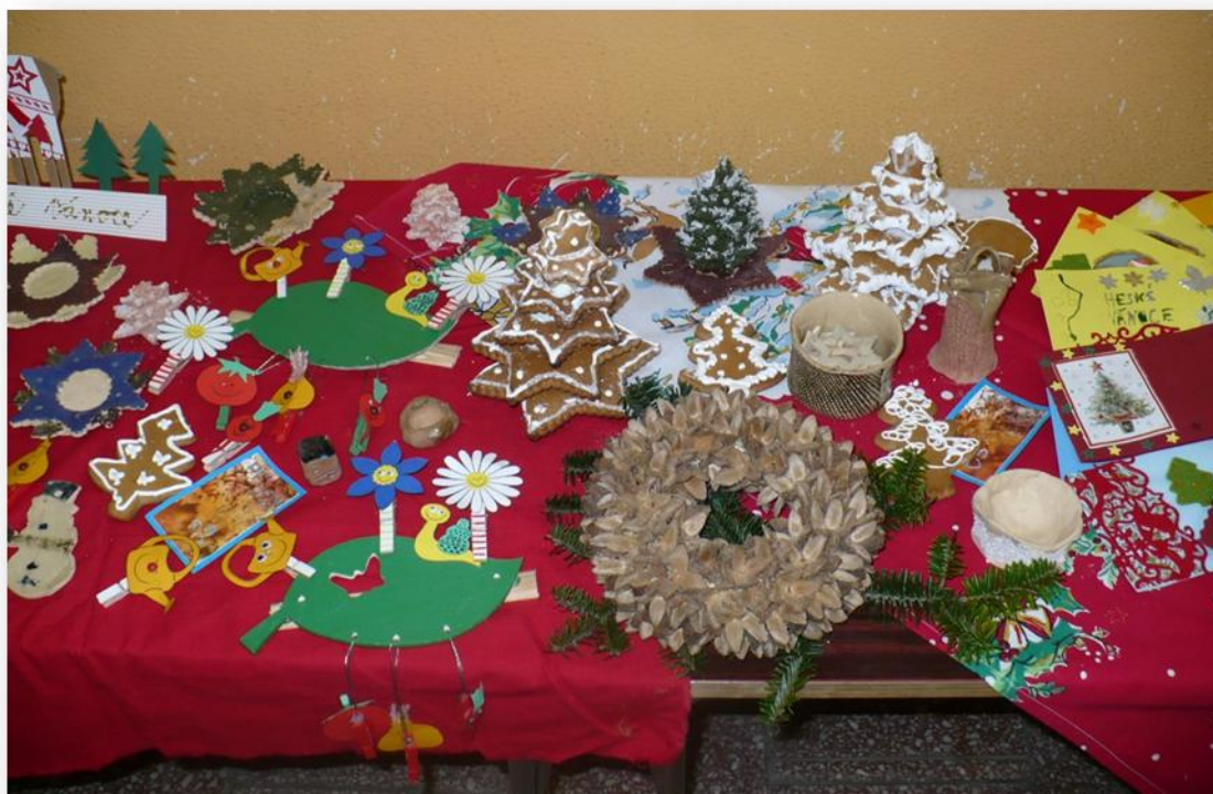
Vyrobené vánoční dárky pro rodiče.