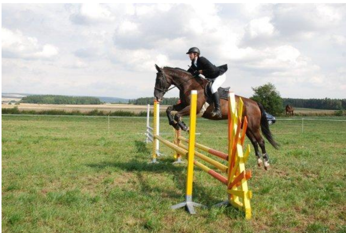
Obrázek 7. Hobby závody 2013