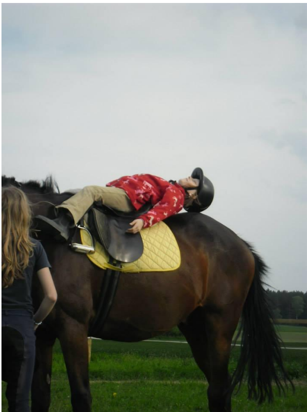
Obrázek 5. NZDM Prevence s Bonanzou - LPPJ