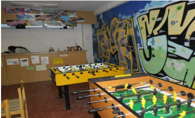
Obrázek 1. Nízkoprahový klub Díra Svitavy