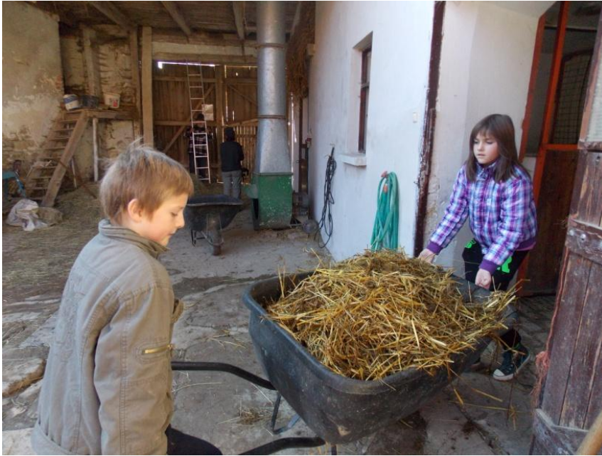
Obrázek 4. NZDM Prevence s Bonanzou – spolupráce klientů