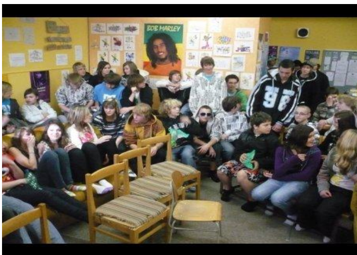
Obrázek 3. NK Díra Svitavy – Battle Rap 2010