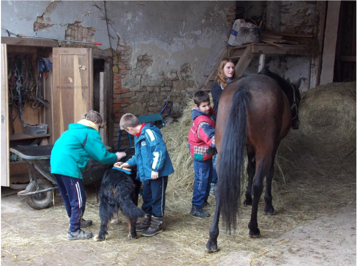
Obrázek 8. Čištění