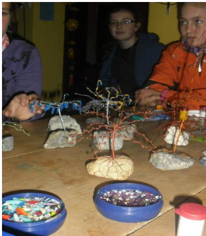
Obrázek 2. NZDM Prevence s Bonanzou – dílny