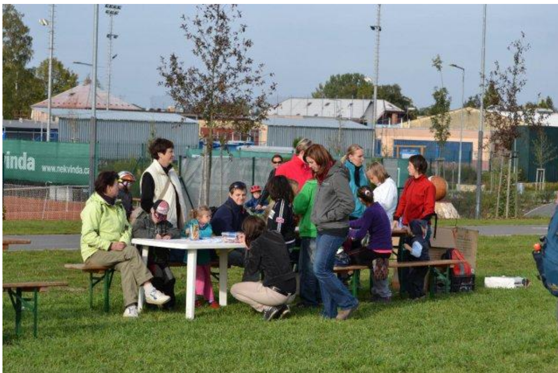
Obrázek 6. Den otevřených dveří 2012