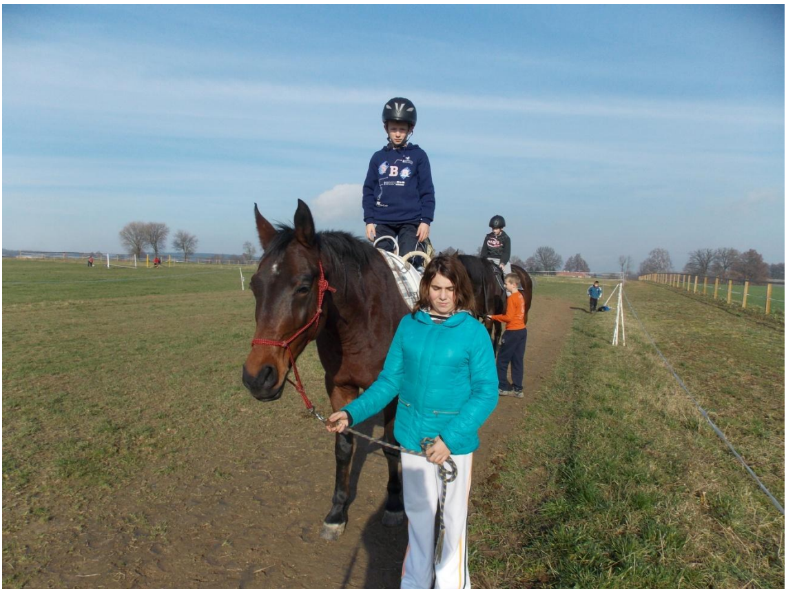
Obrázek 9. Vodění a cvičení klientů