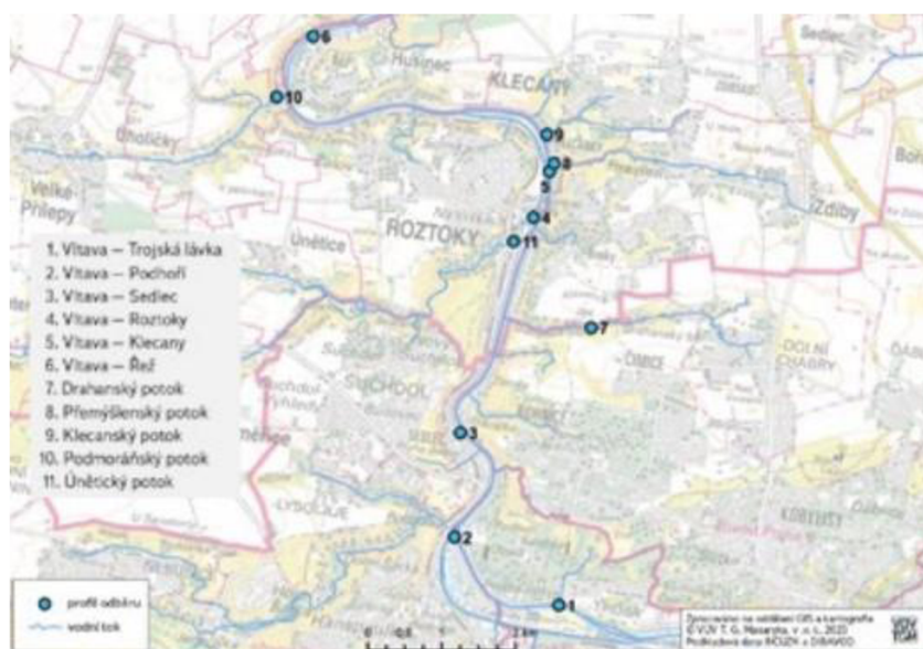
Obrázek 3 - Zákres rozmístění míst odběrů vzorků z řeky Vltavy a jejích přítoků (Zvěřinová, Mlejnková a kol., 2023)

9. Klecanský potok; 10. Podmořanský potok a za 11. Únětický potok. Odběry byly vždy provedeny poblíž ČOV nebo v maximální vzdálenosti do 5 km od ní.